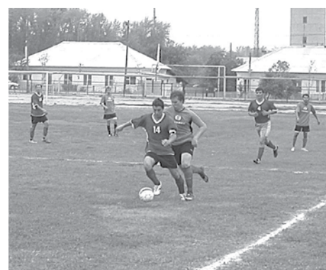
Игровые моменты матча «Факел» (Богданович) — «Космос» (Каменск-Уральский).