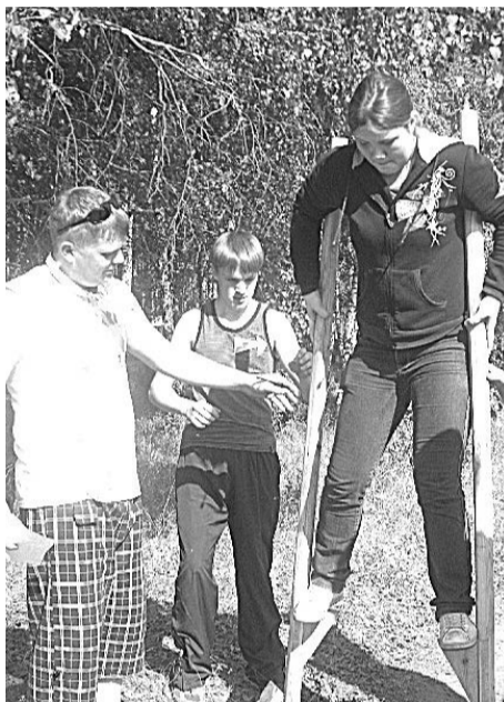
Полосу препятствий (этап «Ходули») проходит команда «Юниор».