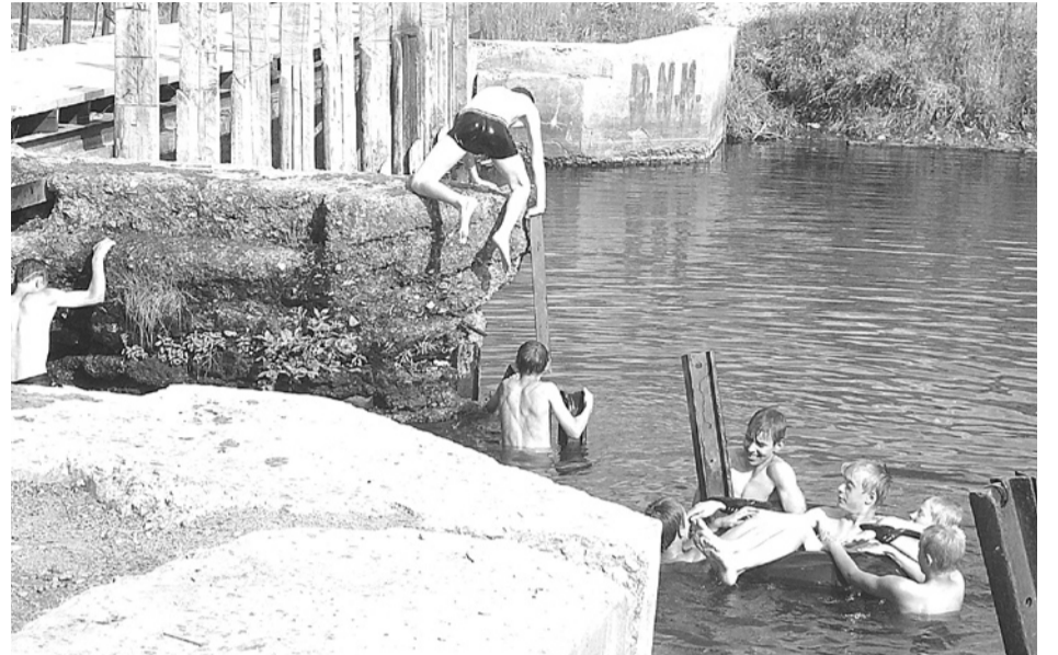
На плотине в северном микрорайоне купаться очень опасно, однако это излюбленное место детей.