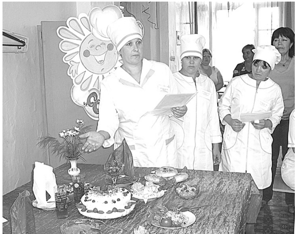
Повара Байновской школы представляют на конкурсе свои блюда.

По итогам конкурса Ильинская школа победила в номинации «За лучшую презентацию», Байновская школа – «За использование информационных технологий в кулинарном деле», а Троицкая – «За лучшую сервировку стола». Номинация «За проведение тематических дней» по праву досталась школе № 5, а «За расширенный ассортимент» – школе-интернату № 9. Также «За развитие кулинарного искусства» награждена Чернокоровская