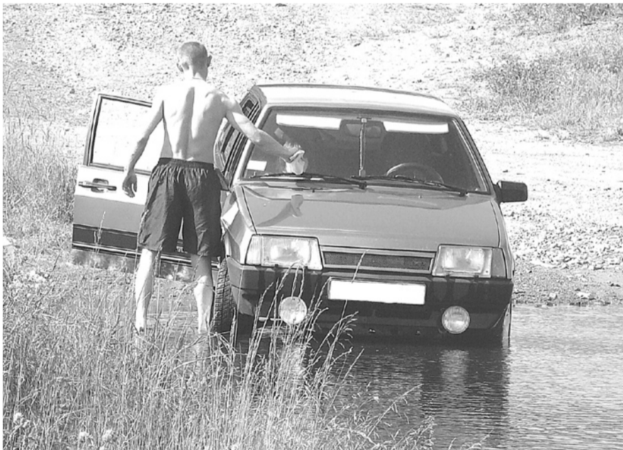
Владельцы автотранспорта знают, что мыть в реке машины нельзя, но все равно моют.

Что побуждает людей мыть машины в реке, так и осталось неясным, так как сами нарушители утверждают, что знают о том, что они нарушают экологическое законодательство, в частности, решение Думы ГО Богданович № 68 от 06.10. 2005 года «О запрете заправки, мойки и ремонта механических транспортных средств в зонах охраны водных объектов...».