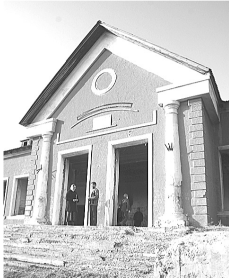
Кашинский храм во имя святителя Николая.