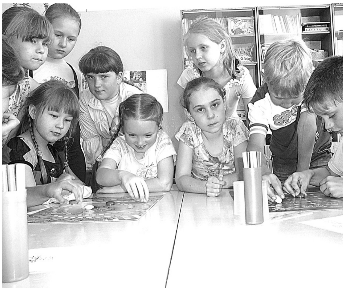
В отряде «Радуга» лагеря «Солнышко» (школа N 1) ребята любят играть в настольные игры.

Помимо общелагерной жизни, ребята примут участие в районных ме-