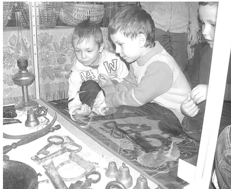
Ребятам из детского сада в музее интересно все.

Е. ФОМИНЫХ, старший воспитатель детского сада N 15.