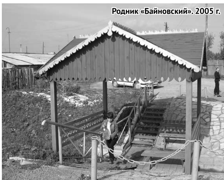
Родник «Байновский». 2005 г.

Конечно, кто-то может сказать: «Обустроивали родники по областной программе, работали все на показуху, а сейчас никому ничего не надо». Однако давайте задумаемся, откуда появляется мусор на родниках и кто ломает все декоративные элементы. Ответ очевидный: мы сами . Ни один металлический забор, ни одна деревянная конструкция, а соответственно, ни один родник в целом не выдержит такого разрушительного, безнравственного, безответственного поведения людей. Хочется верить, что все родники вновь приведут в порядок. И от нас зависит, как долго продержится этот порядок.