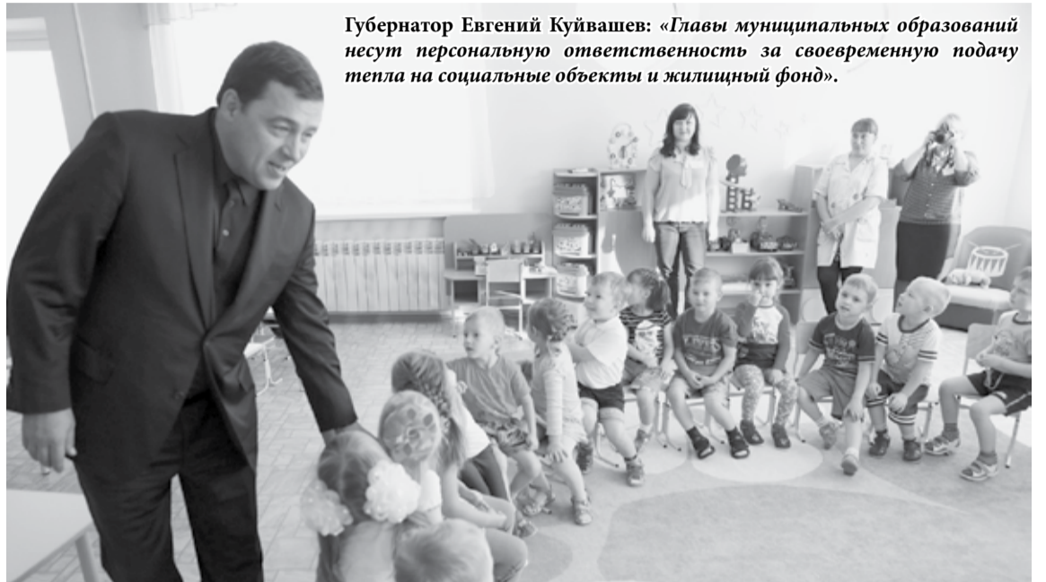
Губернатор Евгений Куйвашев: «Главы муниципальных образований несут персональную ответственность за своевременную подачу тепла на социальные объекты и жилищный фонд».

Отметим, аналогичная «горячая линия» будет открыта с 12 октября и в министерстве энергетики и ЖКХ области, номера телефонов будут сообщены дополнительно.