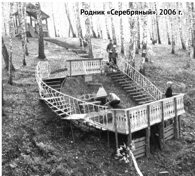
Родник «Серебряный». 2006 г.