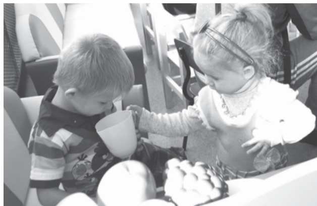
Дети быстро освоились в новой группе и принялись играть новыми яркими игрушками.

Казачий атаман остался доволен тем, как кадетский корпус подготовлен к началу учебного года, и уровнем подготовки юных казачат.