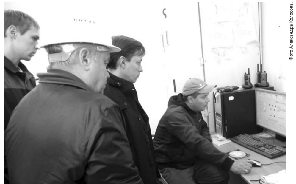
...и технологией производства нового завода.

P.S. Когда верстался этот номер, завод успешно произвёл пробный запуск печи.