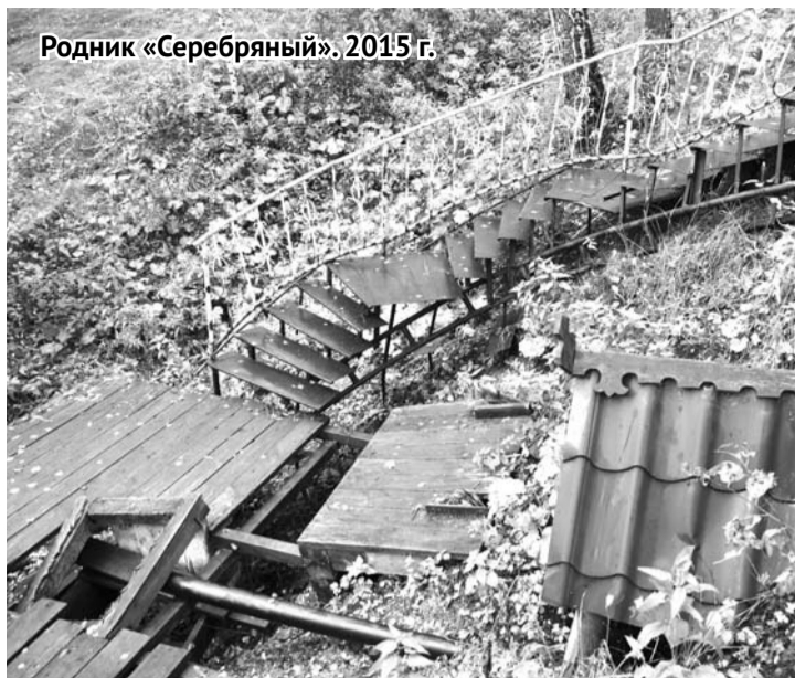
Родник «Серебряный». 2015 г.