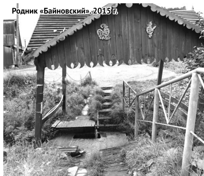
Родник «Байновский». 2015 г.