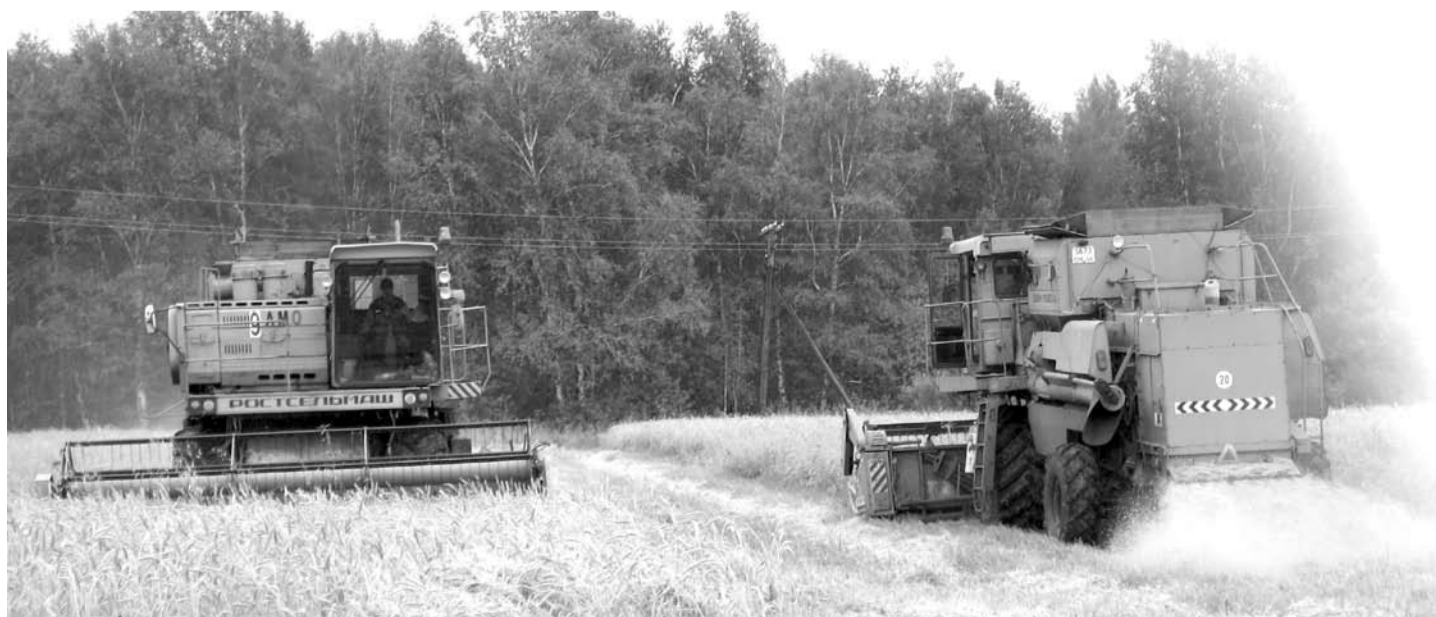
Зерноуборочные комбайны СПК «Колхоз имени Свердлова» в погожие дни работают дотемна.

- Я думаю, что зерна соберём на уровне прошедшего года.