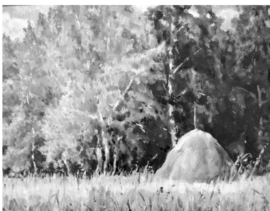
Геннадий Топорков «Вёдро». Холст, масло.

Читаю, смотрю, дышу красотой и чистотой слова, глубиной мысли. Как всего этого не хватает в нашей жизни! Как это вовремя...»