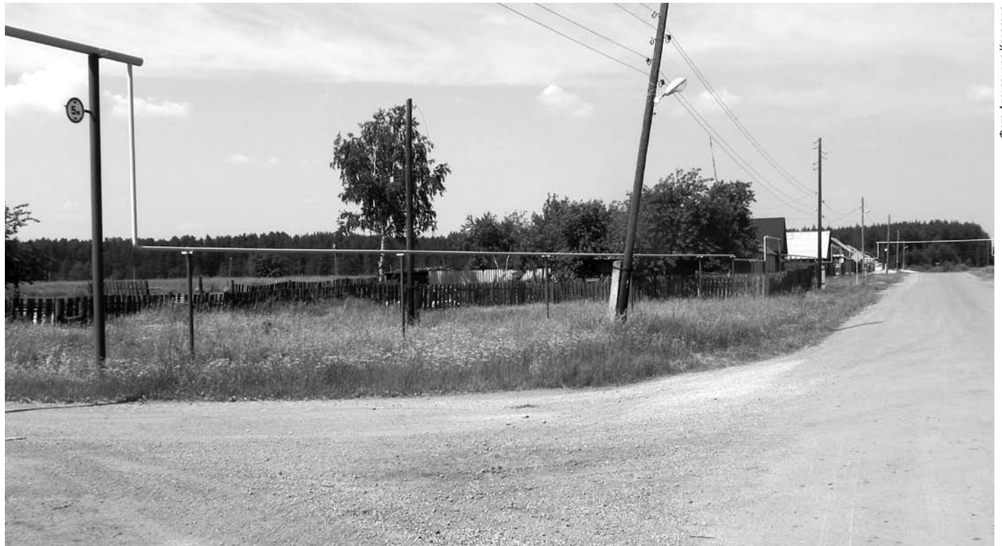
Газопровод, построенный на ул. Мира в селе Кунарском.

должен обратиться в газораспределительную организацию (ГРО) за получением технических условий на строительство газопровода, заключить договор на его строительство до границ участка и получить техусловия на строительство газопровода непосредственно на территории своего участка. В нашем городском округе такой организацией является КЭС ЗАО «ГАЗЭКС» («Горгаз»). Газопроводы, на которые техусловия были выданы до 1 марта 2014 года, строятся администрацией. Все остальные – ЗАО «ГАЗЭКС».