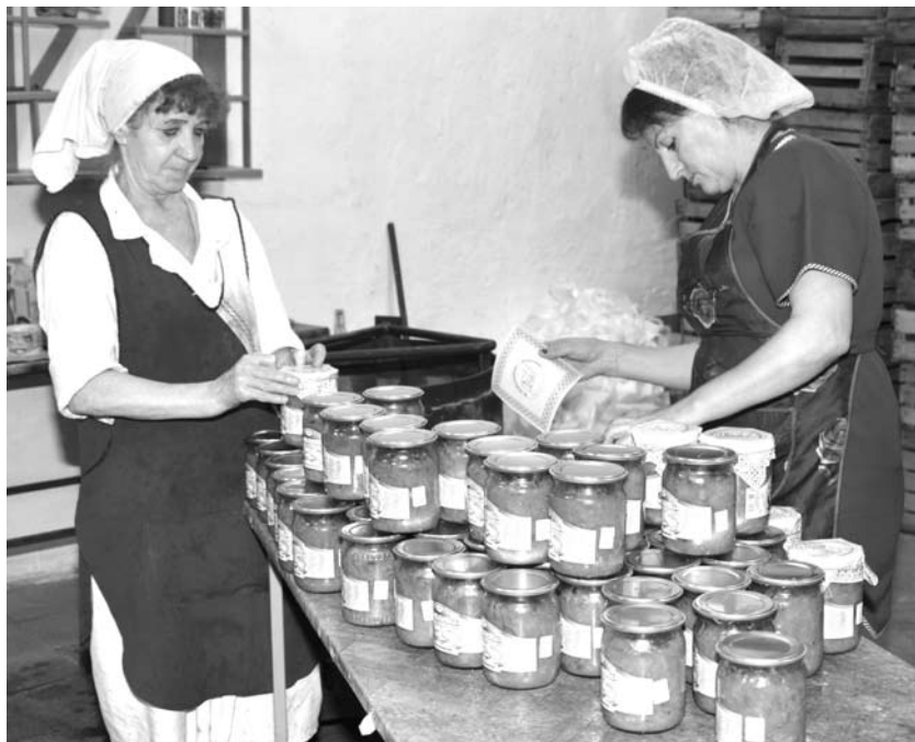
Склад пищекомбината опустошается с большой скоростью, что радует работников предприятия.

В преддверии нового урожая огурцов коллектив пищекомбината подготовил оборудование и произвёл косметический ремонт производственных помещений. И ждёт поступления сырья.