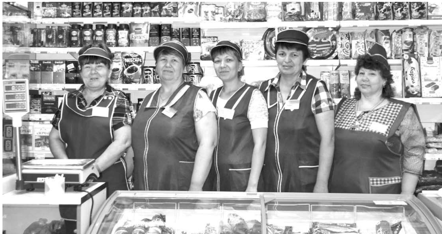
Коллектив магазина «Продукты» в с. Кунарском очень дружный и сплоченный, их объединяют любовь к профессии, ответственность и доброжелательное отношение к покупателям.