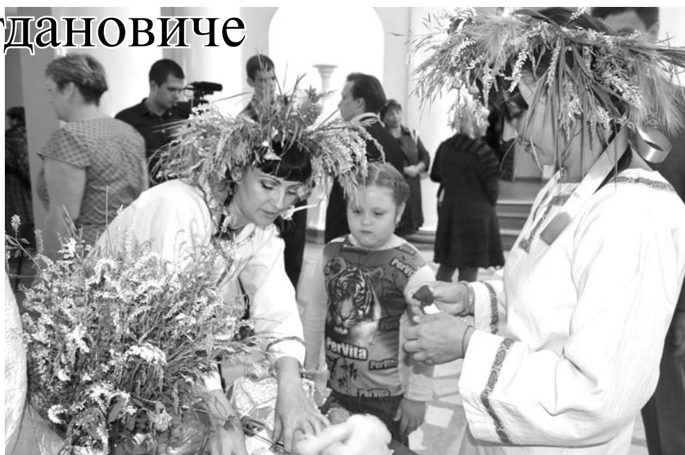
На фестивале проходили различные мастер-классы, в том числе и по плетению кукол.

Участники фестиваля выступали в номинациях «Кадриль», «Частушка», «Народные игры» и других. На сцене происходило нечто невероятное: зажигательная кадриль сменялась озорными частушками, те, в свою очередь, уступали место народным играм. Артисты показали, что русские народные гуляния с песнями и плясками не могут никого оставить равнодушным.