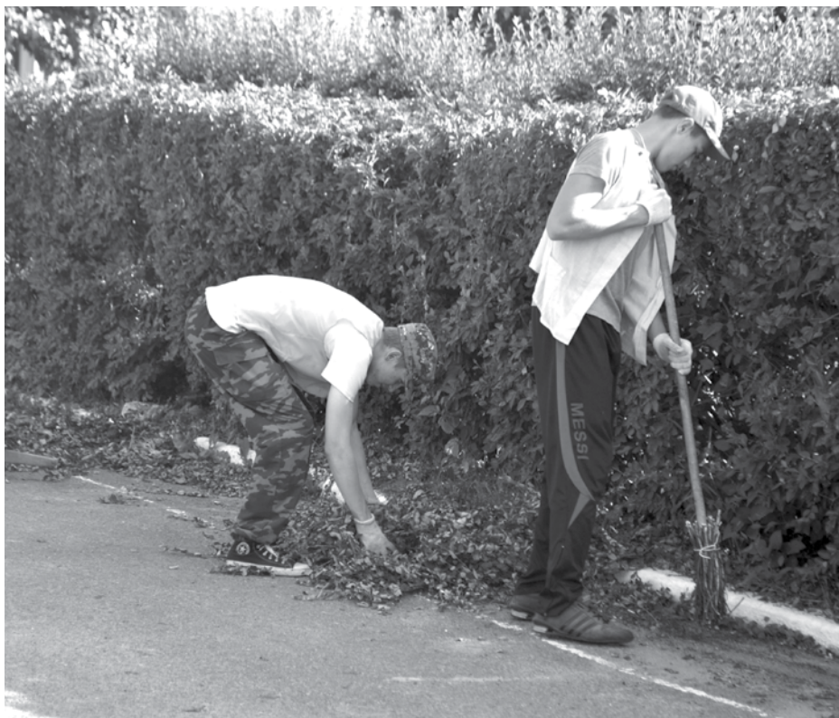
Ребята с молодежной биржи труда следят за чистотой на площади Мира.

На сегодняшний день трудоустроено уже 148 человека. Ребята трудятся на молодежной бирже труда, заключен договор с МУП «Благоустройство», там в месяц будет трудиться по пять человек. Детско-юношеская спортивная школа берет себе двух работников, детский дом ежегодно принимает