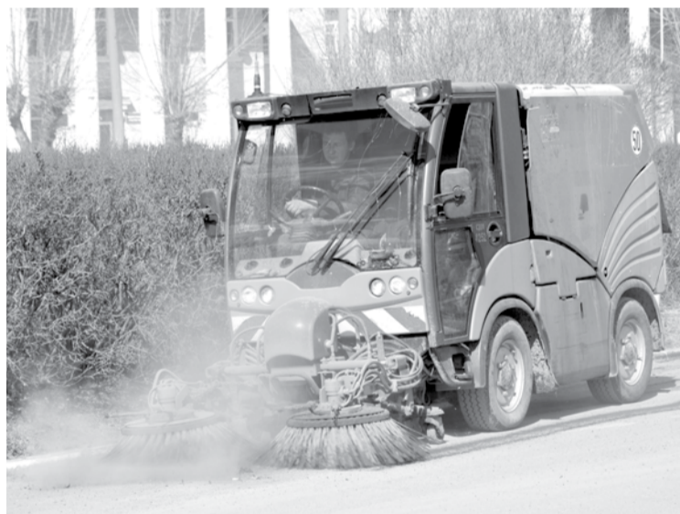
Вакуум-подметальная машина «Nako City master-2000» чистит дорогу на улице Советской.

С конца второй декады апреля работники «Благоустройства» приступили к ямочному ремонту дорог, а их разметку планируется произвести в промежутке между двумя майскими праздниками.