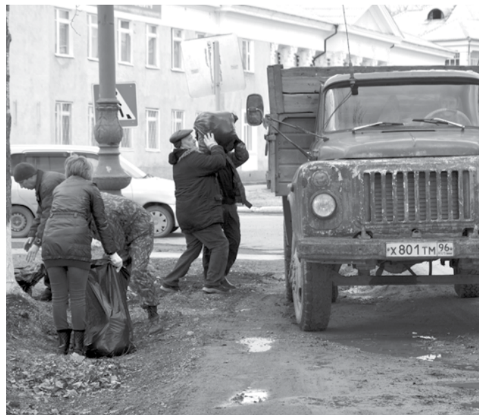
Уборкой мусора на участке улицы Ленина от Мира до Советской занялись работники ООО МУП «Уютный город».