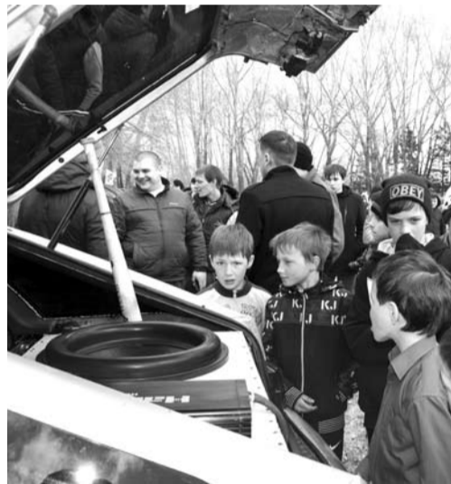
Каждый мог подойти к любой машине и посмотреть ее звуковое оснащение.

В общем и целом фестиваль удался на славу. Долго в парке звучала музыка, и народ не спешил расходиться, наслаждаясь «экстремальной» обстановкой.