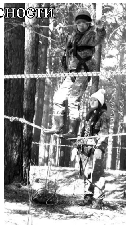
Богдановичским ребятам не страшны никакие препятствия.

Богдановичцы достойно прошли все испытания, показав умения и навыки, полученные в ходе систематических тренировок. А самое главное – это командный дух, который не покидал нашу команду на протяжении всего туристического первенства. И как следствие, у наших ребят 11 призовых мест и второе место в общекомандном зачете. Уступили