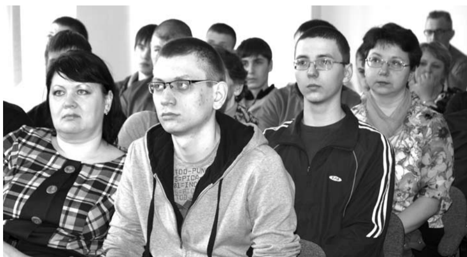
Будущие воины и их родители с большим вниманием слушали напутствия выступавших.

Желающих сказать теплые слова призывникам и их родителям было немало. Среди них депутат Думы ГО