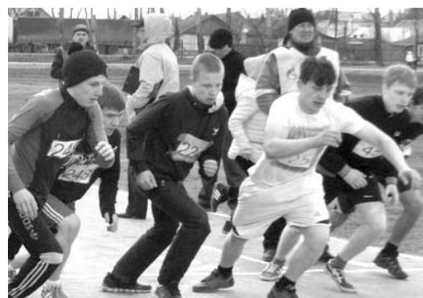
Каждый легкоатлет выложился по максимуму, преодолевая дистанцию.