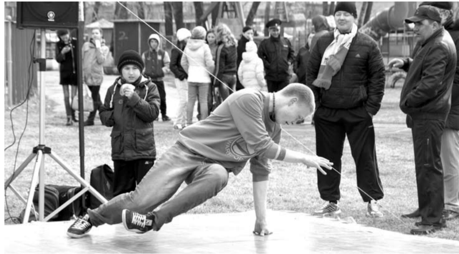
Открытие экстремального сезона в Богдановиче прошло массово и интересно.

Одними из самых зрелищных были соревнования по автозвуку. До старта каждый мог подойти к любой машине и посмотреть ее звуковое оснащение. Здесь можно было увидеть различные акустические