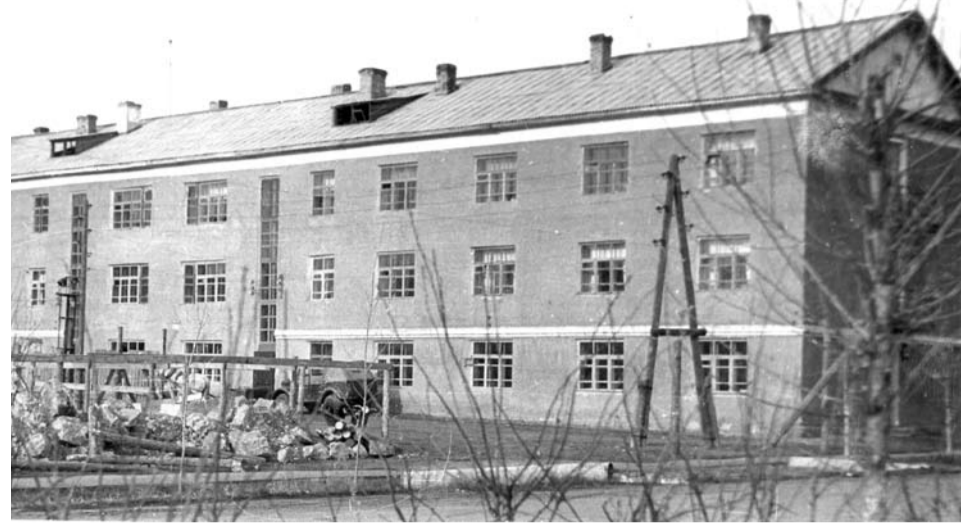
В этом здании на первом этаже находился отдел ЗАГС а в годы войны.

Так же, как и сейчас, в военные годы от уплаты государственной пошлины освобождалась регистрация актов рождения, смерти и усыновления. Если работники органов ЗАГС а совершали действие без оплаты госпошлины либо неправильно или несвоевременно её взимали, они подвергались штрафу в размере до 100 рублей.