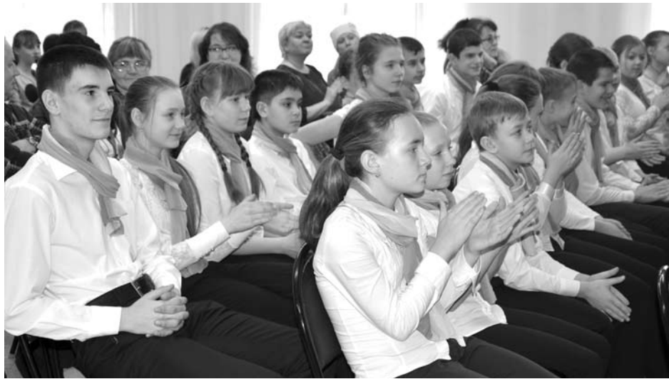
Успехам учеников школы №3 на торжественной линейке «Аплодисменты» радовались одноклассники, родители и педагоги.