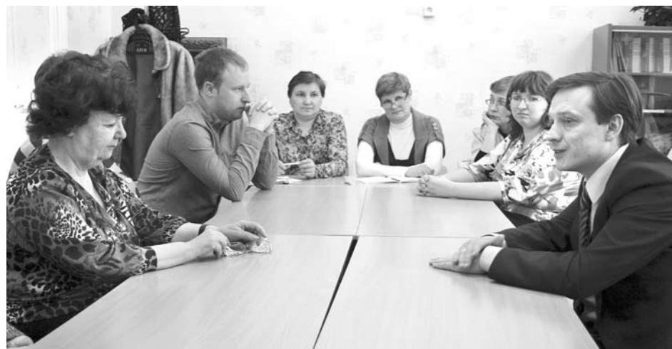
После своеобразной экскурсии по образовательному учреждению руководитель территории побеседовал с педагогами, ответив на все поступившие вопросы.

Нужно отметить, что на протяжении последних трех лет эта школа, как, впрочем, и другие сельские образовательные учреждения городс-