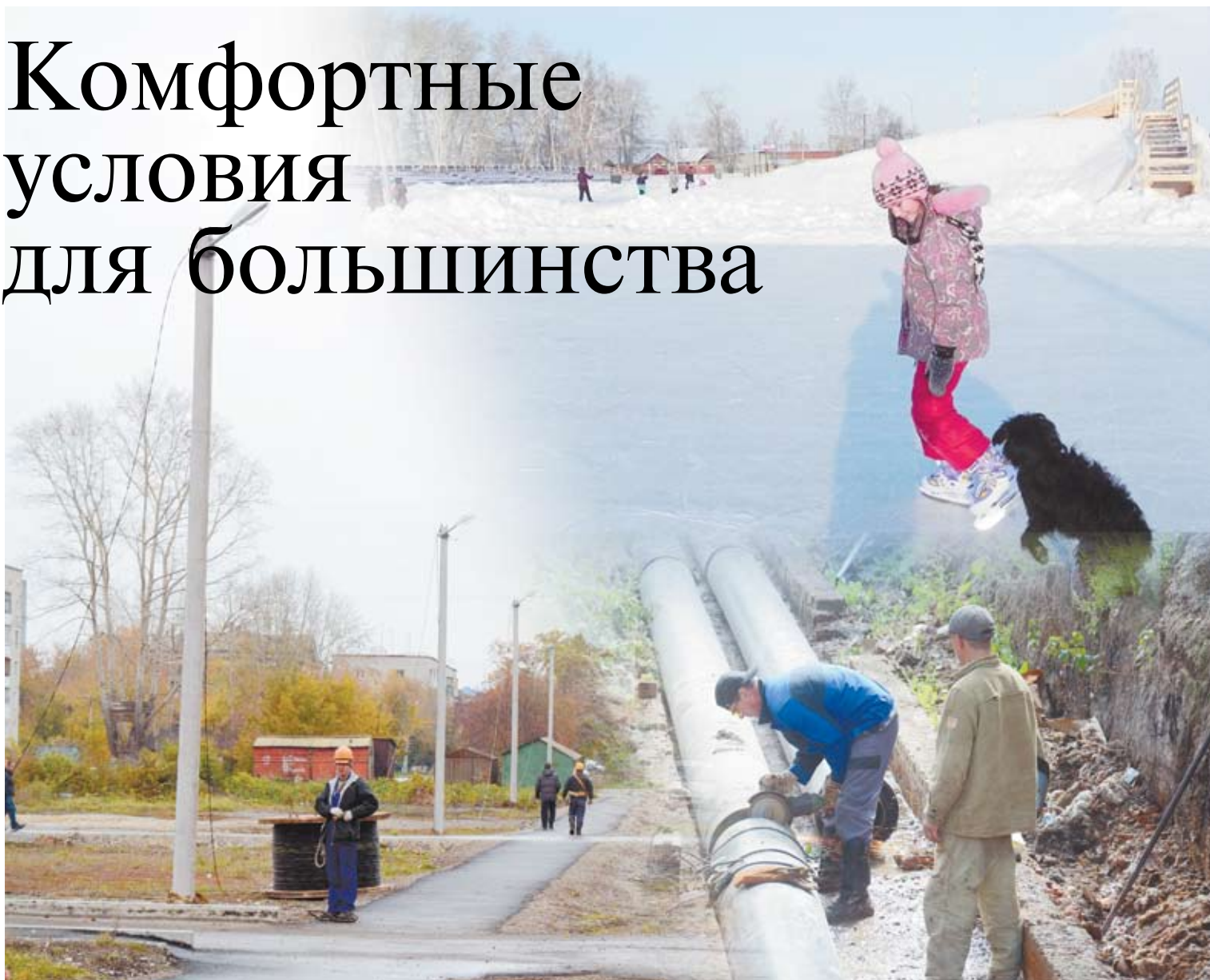
Коллаж Марины Бурлаковой. Фото из архива редакции.