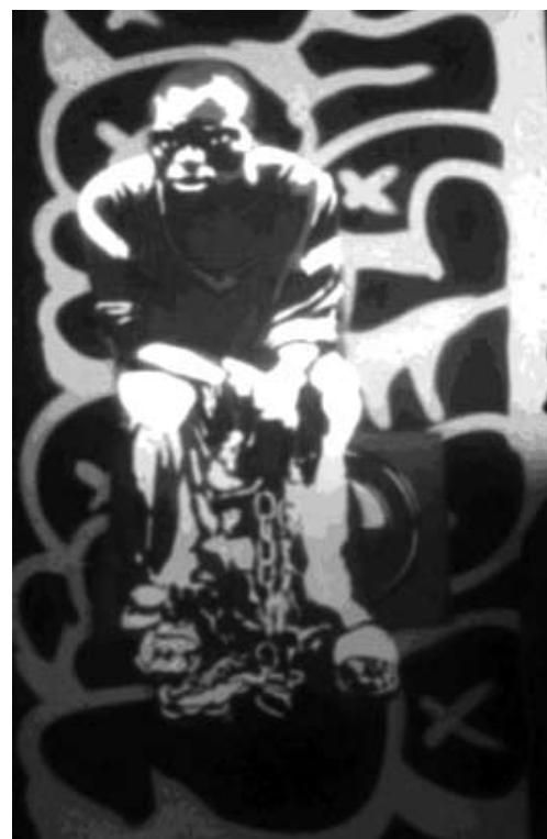
Африканец, закованный в цепи. Автор – Павел Бодрый.

В основном Павел использует для картин три цвета, находя изображения в Интернете, которые впоследствии переносит на трафарет из плотной бумаги, а далее уже переносит на «холст». В целом на изготовление одного трафарета у него уходит от трех часов до двух дней и порядка двух часов – на нанесение изображения на основу. Среди его картин можно встретить и пионера с трубой, и афроамериканца, закованного в цепи. Раньше о творчестве Павла знали только его родные и друзья, в скором