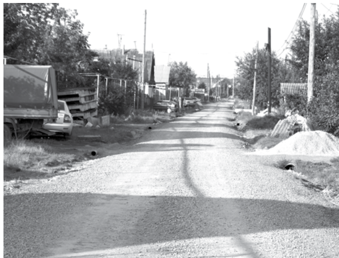
Щебёночные дороги стали лучше.

В городском округе Богданович на балансе находятся 350 километров автомобильных дорог, из них 120 километров дорог асфальтированных, 130 – со щебёночным покрытием (дороги переходного типа), остальные – грунтовые. Щебёночные дороги давно не ремонтировались, и в 2014 году эту ситуацию частично исправили – там, где наиболее интенсивное движение автотранспорта: улицы Пургина и Озёрная, переулки Александра Матросова и Олега Кошевого в городе, улицы Чкалова и Автомобилистов в Байнах, улицы Челюскинцев и Тимирязева в Троицком. Выполнялся и ремонт самых проблемных участков асфальтовых дорог: на улице Первомайской в районе Коменского переезда, на улицах Труда и Крылова в Богдановиче.