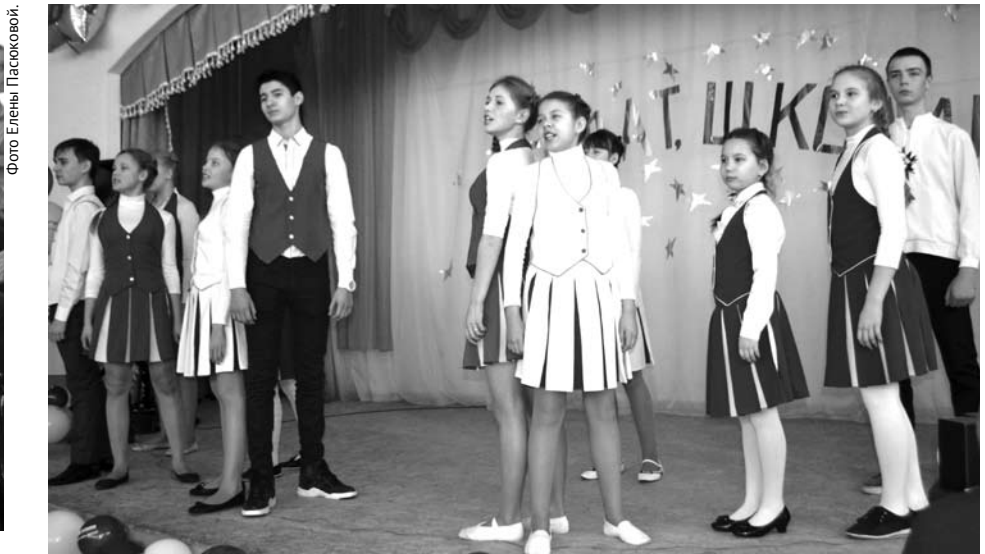
Учащиеся школы №2 выступили с презентацией, которую с блеском представили на олимпиаде.