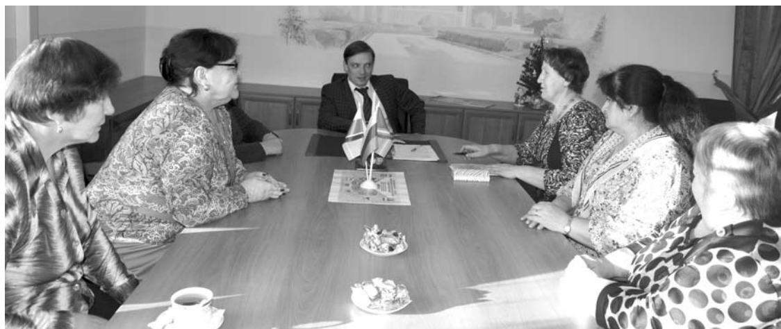
В ходе общения с главой солдатские матери задавали разные вопросы, в том числе по патриотическому воспитанию молодежи.