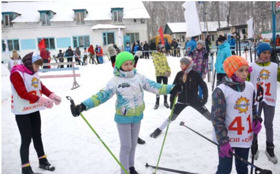
Перед выходом на трассу важна разминка, чем непосредственно и занимались спортсмены.

Команды «Экипо» (г. Красноуфимск) и «Колорит» (г. Богданович) сыграли со счетом 48:85 в пользу Богдановича.