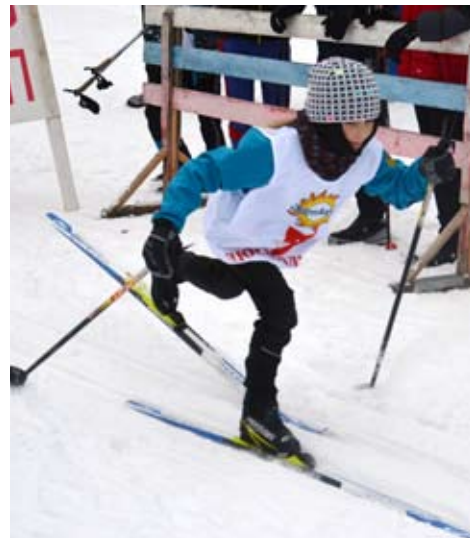
«На старт! Внимание! Марш!» Три слова на старте заставляют нервы спортсменов натянуться до предела.

На торжественном открытии соревнований перед участниками выступил министр физической культуры, спорта и молодежной политики Свердловской области Леонид Раппопорт. Он пожелал участникам честной спортивной борьбы, а тренеров команд поблагодарил за то, что они развивают старославянскую национальную игру «Русская лапта».