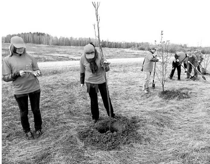
Новые посадки протянулись на четверть километра.

А 3 мая члены Совета молодежи выехали в окрестности