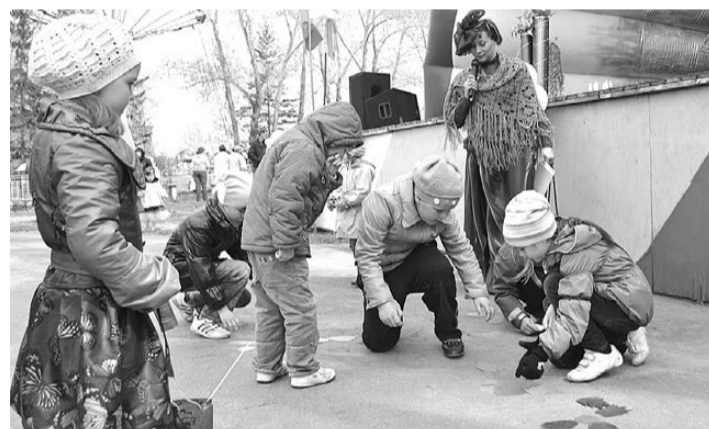
В день открытия парка главными гостями были дети, с которыми проводилась масса игр.

Фотографии с мероприятия смотрите на нашем сайте.