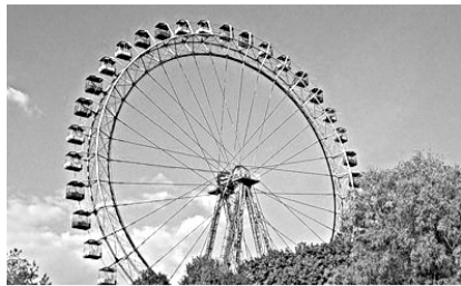
ГОРОДСКОЙ ПАРК ОТКРЫЛ ЛЕТНИЙ СЕЗОН