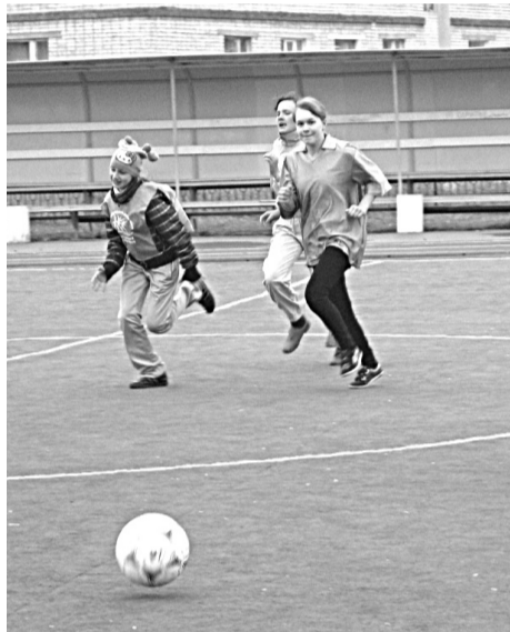
Девочки в отличие от мальчиков в футболе более непосредственны, они играют по олимпийскому принципу, получая удовольствие от игры, а не гонятся за победой любой ценой.

В итоге за 1-3 места боролись три сильнейших команды: школы № 9, № 5 и Полдневская. Интрига в этих соревнованиях была в каждом матче, так