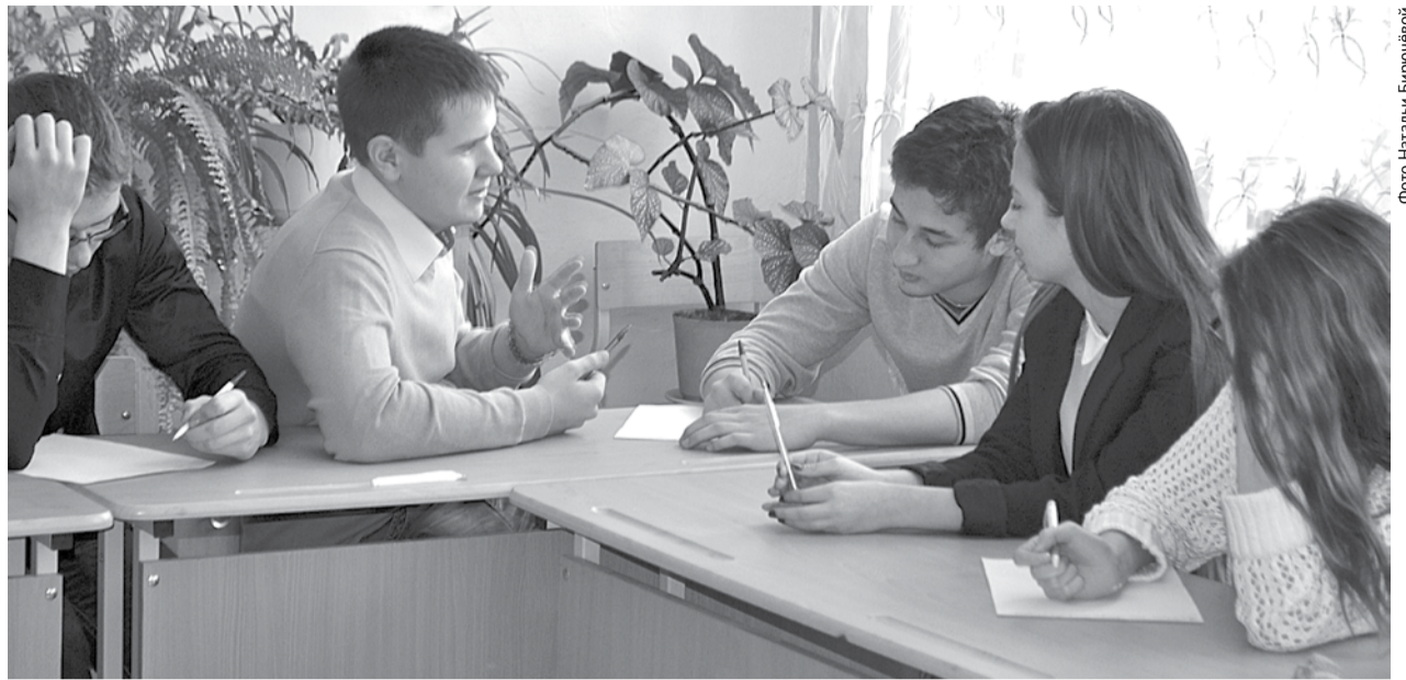
Разговор с ребятами получился конструктивным. Они охотно высказывали своё мнение, искали причины конфликтов между детьми и родителями.

В ходе беседы ребята приводили примеры из своей жизни и литературных произведений. И вот к каким выводам мы пришли в результате 45-минутного разговора.