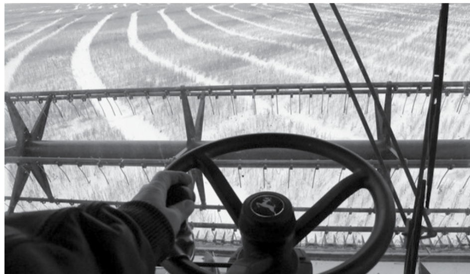
Конечно, обмолачивать зерновые по снегу – не сахар. Но не оставлять же!

поступало с повышенной влажностью и порядочно теряло вес после просушки. Богатый урожай дался нашим сельчанам ценой упорного труда и благодаря хорошей организации работ. А также потребовал солидных затрат на энергоносители, что в полях, что в зерносушильных комплексах. Наши сельчане наглядно доказали, что нет таких условий, при которых они не смогли бы собрать зерно.