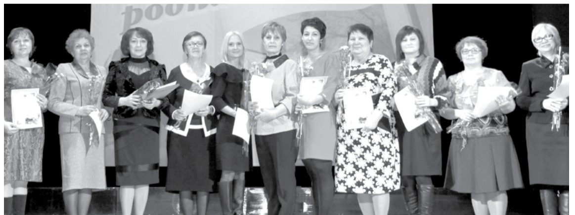
Педагоги школы № 4, награжденные грамотами управления образования ГО Богданович.