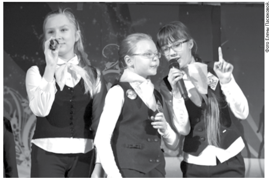
Учить правила безопасности лучше с помощью юмора, что и доказали КВНщики.