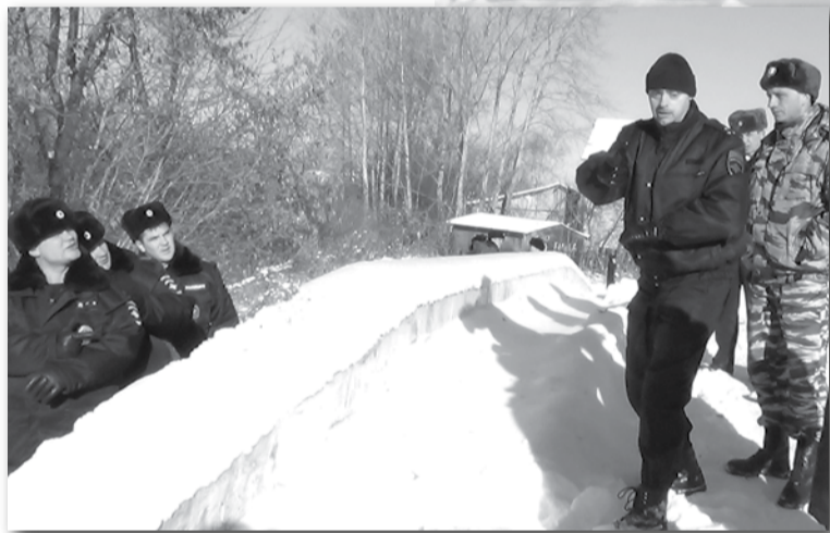
Полицейские часто проводят учебные тренировки, ведь когда преступник вооружен, могут возникнуть разные ситуации. Задача тренировок - отработать как можно больше сценариев: как говорится, тяжело в учении - легко в бою.