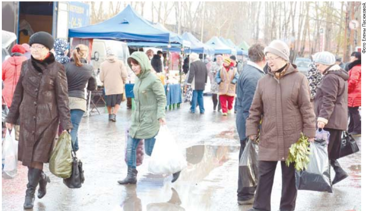
На ярмарке каждый покупатель нашел свой товар.