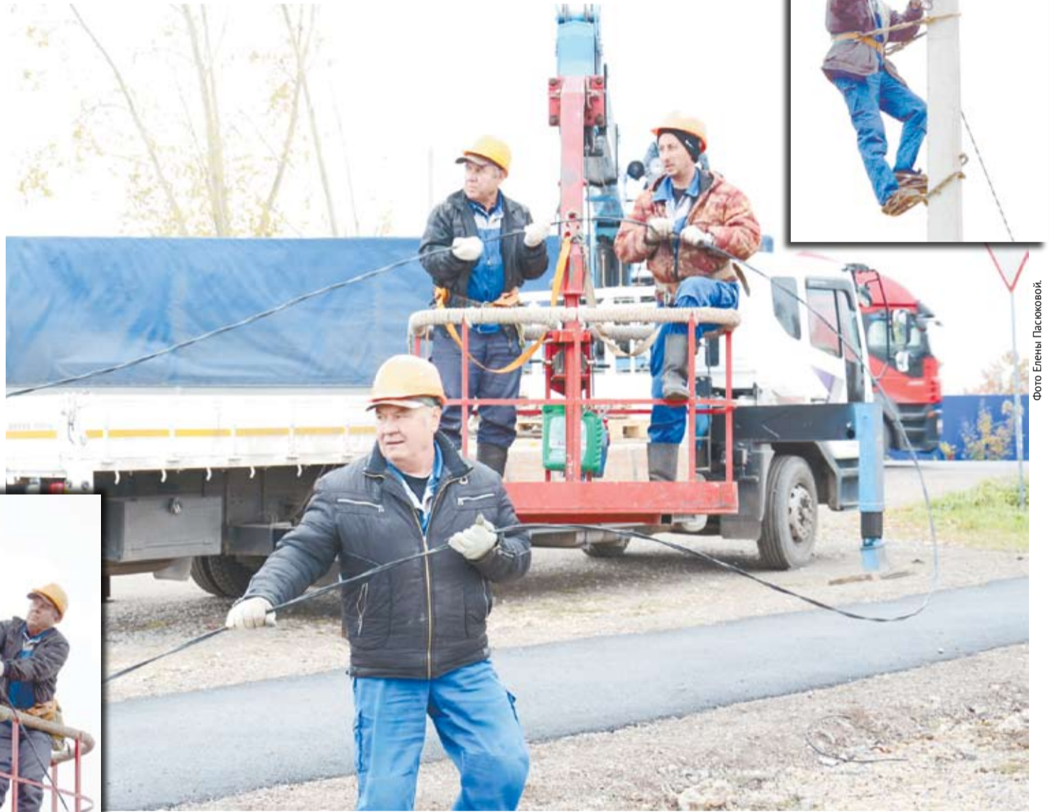
Освещение в Богдановиче проводит ООО «Энергетик». Новые фонари установлены на участке улицы Гагарина от улицы Октябрьской до выхода на улицу Кунавина.