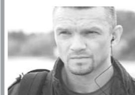
22.55 Т/с «Кремень. Освобождение» (16+)