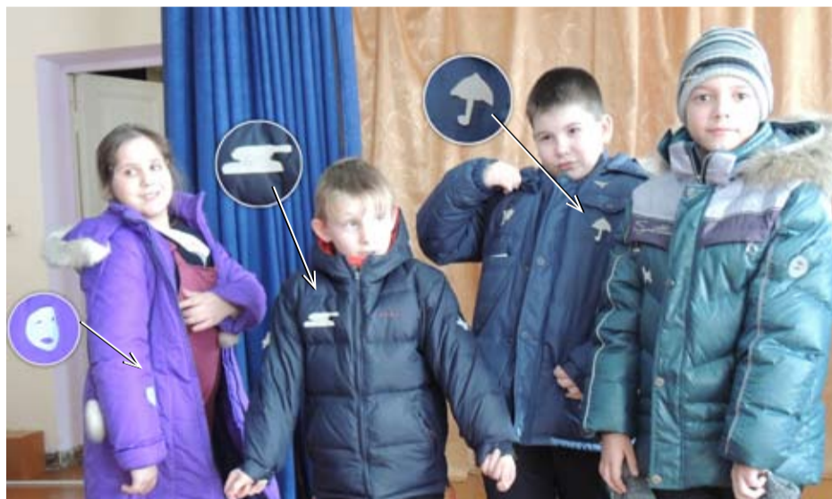
«Светлячки» на куртках детей делают их заметными в темное время суток, и любой водитель увидит ребенка на расстоянии.

Качественные изделия, выполненные в виде полос и наклеек для одежды или рюкзака, браслетов и подвесок, дадут возможность водителю на дороге или в темном дворе вовремя заметить ребенка в свете фар. Белые и желтые фликеры позволяют различить объект на расстоянии до 55 метров, тогда как ребен-