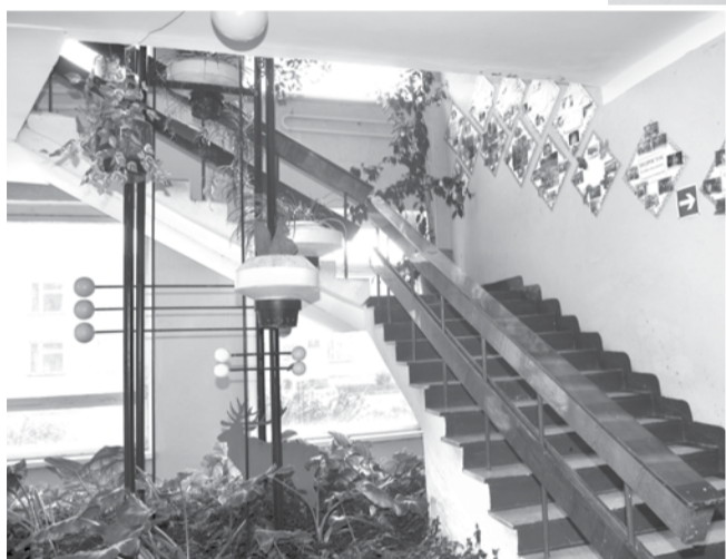
Работники Коменского ДК прикладывают максимум усилий для поддержания красоты и порядка в здании.