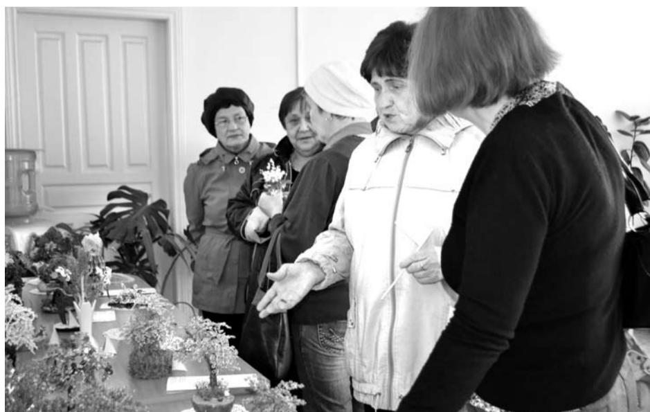
Выставка изделий из бисера, которую подготовили члены клуба «Современник», никого не оставила равнодушным.

Заглядываю в актовый зал и вижу: идёт показ одного из любимых кинофильмов прошлых лет «Весна на Заречной улице». Очень хотелось посмотреть его вместе со всеми, но надо работать. День открытых дверей продлился до 17 часов. Пришедших в этот день гостей ожидало ещё много приятных развлечений: концерт воспитанников стационарного отделения, выставки изделий из бисера, вязаных изделий, книжная выставка. Созданная в этот день работниками ЦСПСиД атмосфера заботы, тепла и праздника окружила пожилых людей, по их лицам было видно, что они довольны таким вниманием. Скучно не было никому.