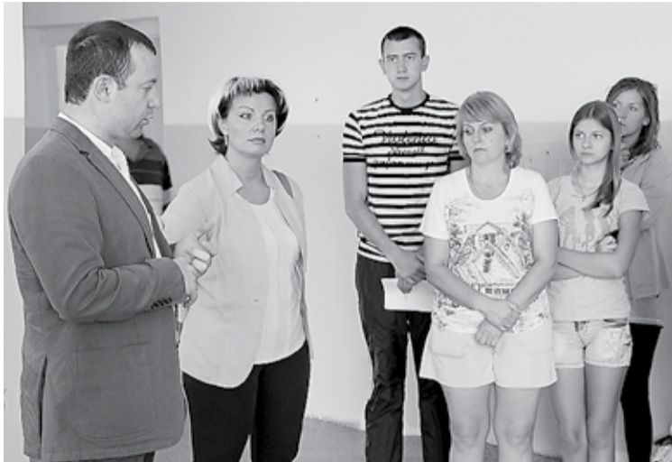
Встреча с переселенцами с Украины

– В их глазах я увидел отчаяние и в то же время надежду на новую жизнь, вдали от бомбёжек, выстрелов и кровопролития. Всех граждан, приезжающих к нам с территории Украины, в первую очередь интересуют вопросы по оформлению документов и присвоению статуса беженца, бла-