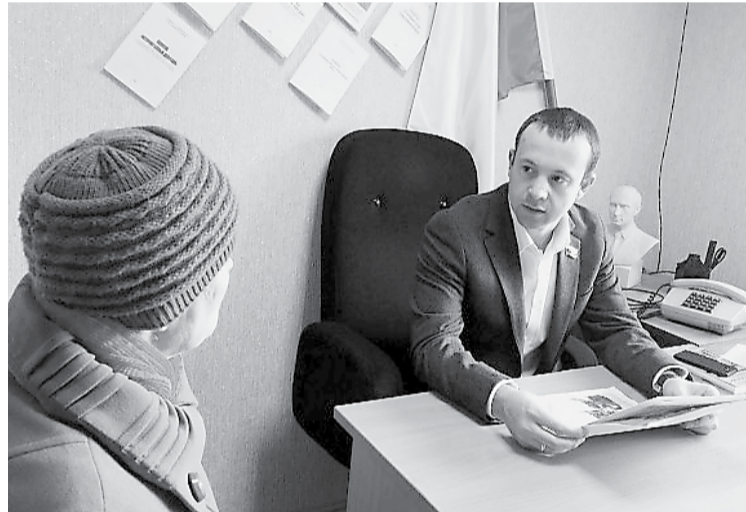
Приём граждан в Богдановиче

прерывный диалог с населением региона, и, в первую очередь, с жителями Камышлова, Пышмы, Талицы, Богдановича и Арамили.