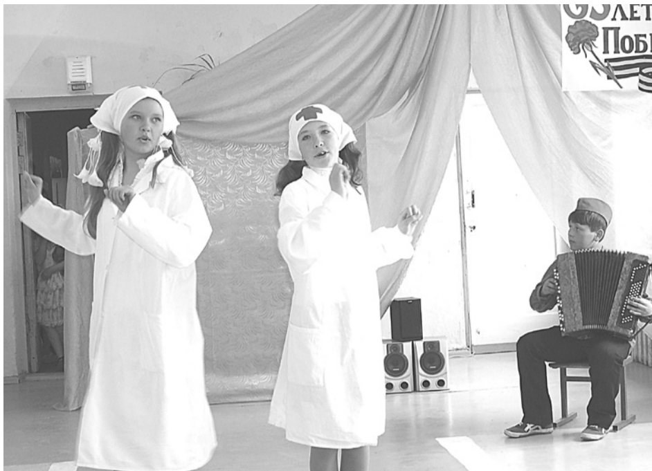
В ходе лицензирования и аккредитации Коменской школы ее ученики показали литературно-музыкальную композицию «Как хорошо на свете без войны».