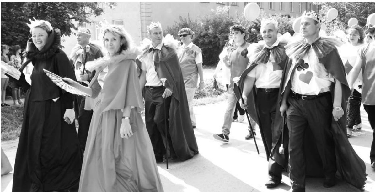
Специалисты администрации ГО Богданович в карнавальных костюмах.

Фотографии с мероприятия смотрите на нашем сайте.