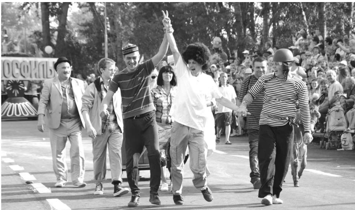
Героев знаменитых комедий Леонида Гайдая представили огнеупорщики.