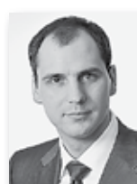
Денис Паслер, председатель правительства Свердловской области:

Учитывая, что в этом году 2397 жителей должны переехать из ветхого и аварийного жилья в новые дома, председатель правительства области Денис Паслер намерен вновь поднять вопрос на одном из ближайших заседаний правительства, считая, что срыва поставленных задач допустить нельзя.