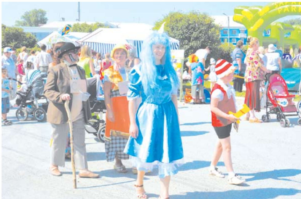
На площади Мира богдановичцы окунулись в мир сказки и кино, встретившись со своими любимыми героями.