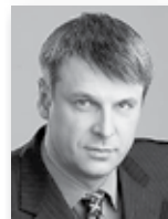
Сергей Носов, глава г. Нижний Тагил:

– Программа переселения граждан в реализации очень сложная, сроки действительно сжаты. Но мы не можем не выполнить наши обязательства перед жителями области, которые сегодня находятся в ненадлежащих жилищных условиях.