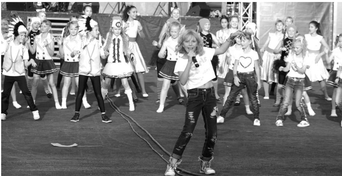
Юные артисты поздравили город с днем рождения задорными и радостными музыкальными номерами.