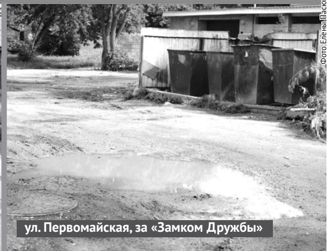
ул. Первомайская, за «Замком Дружбы»

Окончание. Нач. на 1-й стр. ГО Богданович заключила контракт на выполнение работ по частичному ремонту проезжей части улиц Крылова, Труда и Первомайской . Общая площадь выполнения ремонта асфальтового покрытия составляет 740 квадратных метров. Окончание работ запланировано на 20 августа.