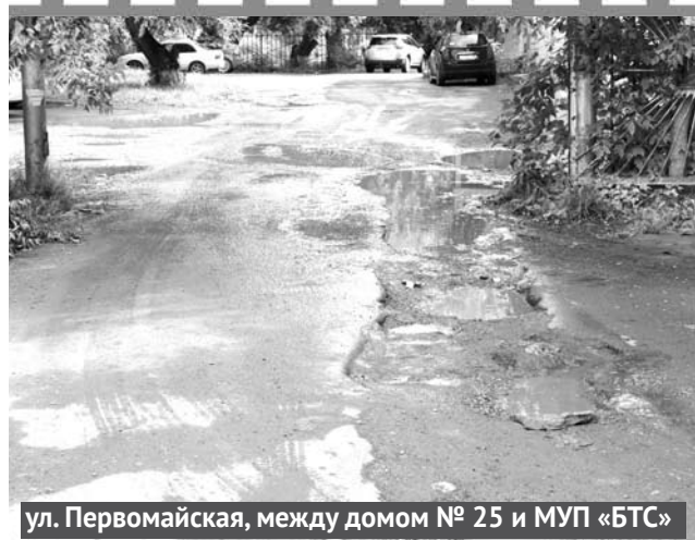
ул. Первомайская, между домом № 25 и МУП «БТС»