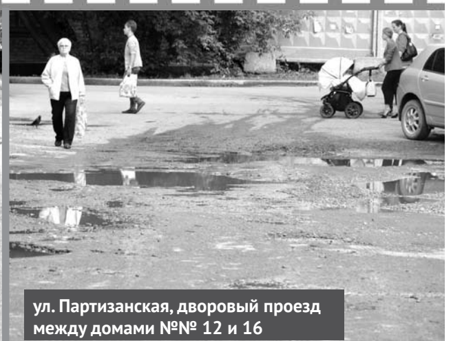
ул. Партизанская, дворовый проезд между домами №№ 12 и 16