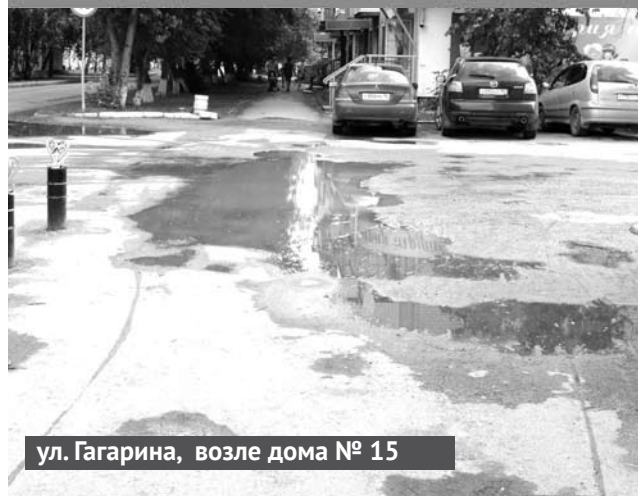
ул. Гагарина, возле дома № 15