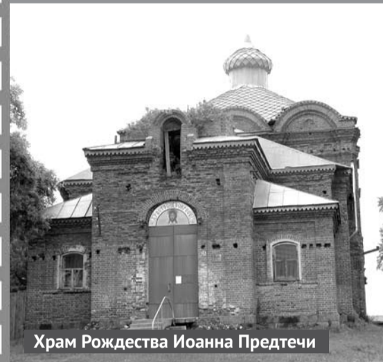
Храм Рождества Иоанна Предтечи