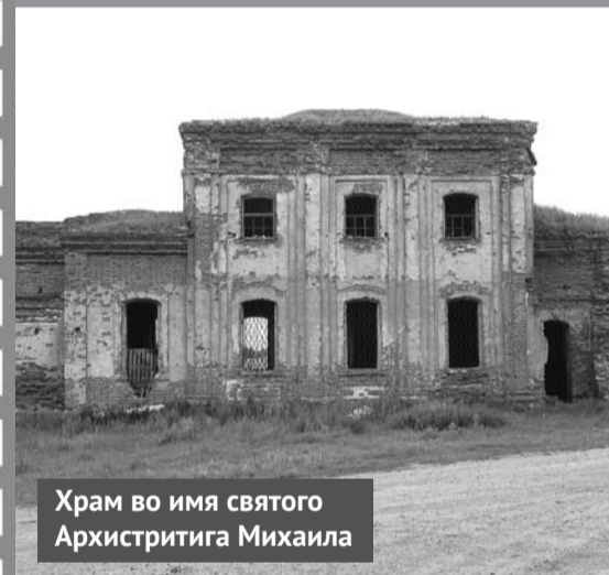
Храм во имя святого Архистратига Михаила