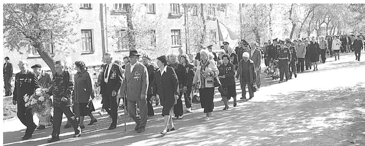
Праздничное шествие возглавляют ветераны.