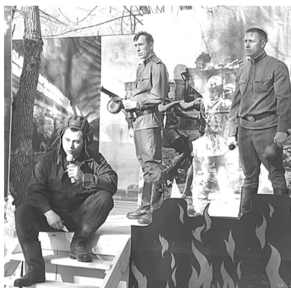
Огнеупорщики напомнили эпизоды войны 1941–1945 годов.