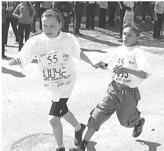
Передача эстафетной палочки на финишном этапе. Команда Коменской школы.