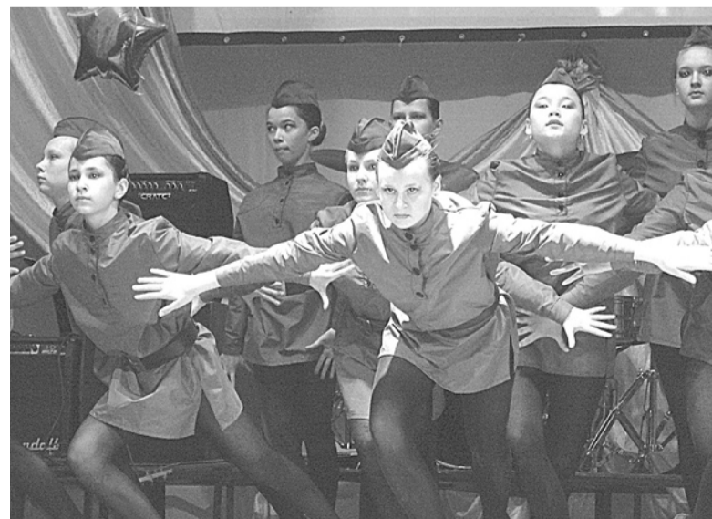
Юные артисты нашего города дарили ветеранам свои музыкальные подарки.