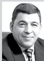
подводили Урал и уральцев на протяжении веков.

Губернатор Свердловской области Евгений Куйвашев: