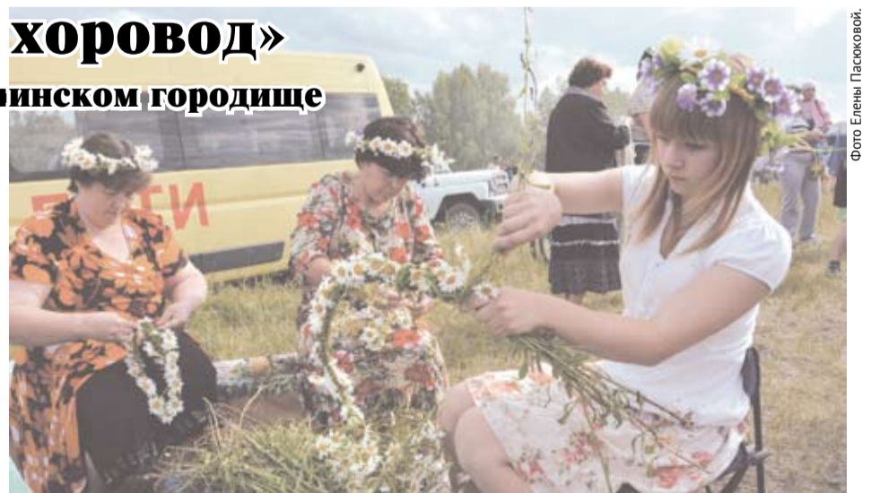
Цветок ромашки – символ семьи, любви и верности. Многие из присутствовавших сплели венки из ромашек не только себе, но и другим гостям праздника.