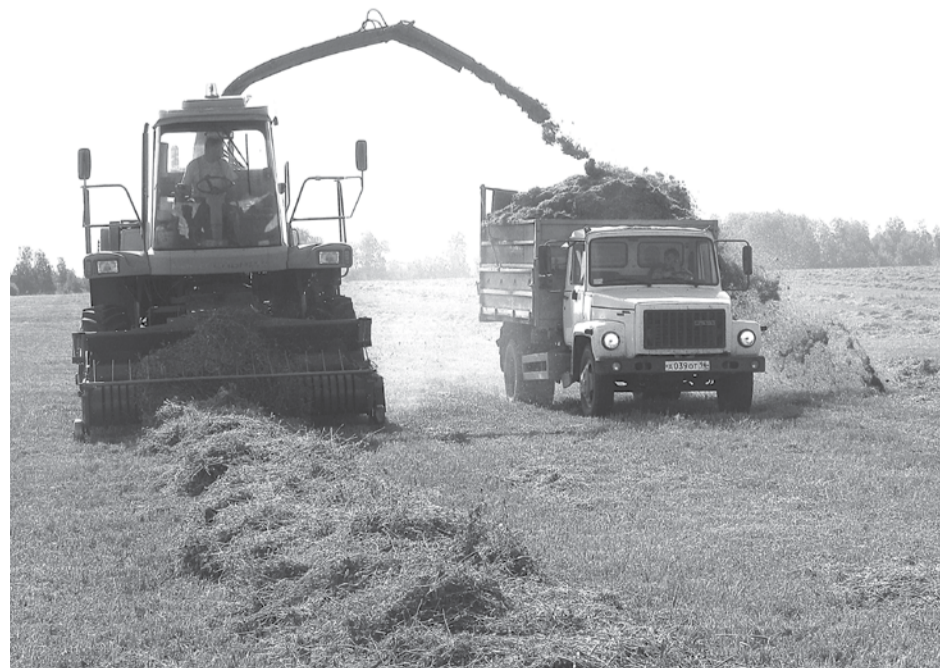
Механизаторы СПК «Колхоз имени Свердлова» ведут подборку зеленой массы трав на сенаж.

– Перед сельхозпроизводителями стоят задачи: обеспечить животноводство полуторогодовым запасом кормов – не менее 27 центнеров кормовых единиц на условную голову скота, повысить уровень обеспечения населения области продукцией растениеводства местного производства.