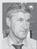
Михаил Копытов, министр АПК и продовольствия Свердловской области:

«Мы ежегодно улучшаем показатели и постоянно находимся в десятке лучших производителей молока в России. Это происходит благодаря стабильной, увеличивающейся с каждым годом областной и государственной поддержке животноводов, грамотной политике, которую ведут руководители сельхозпредприятий в области кормозаготовки и созданию генетического потенциала крупного рогатого скота на Урале».