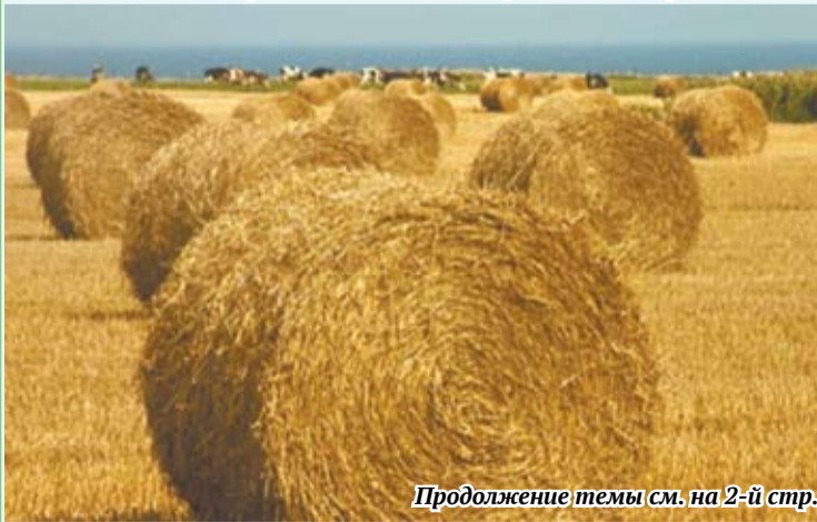
Продолжение темы см. на 2-й стр.

Кормовых единиц на условную голову КРС – 25 центнеров