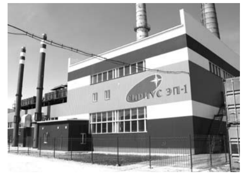
... а так она выглядит сегодня.