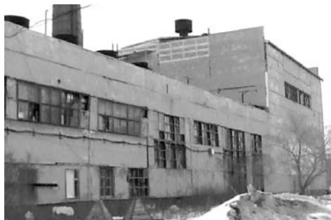
Бывшая котельная фарфорового завода до появления ОАО «БГК»...