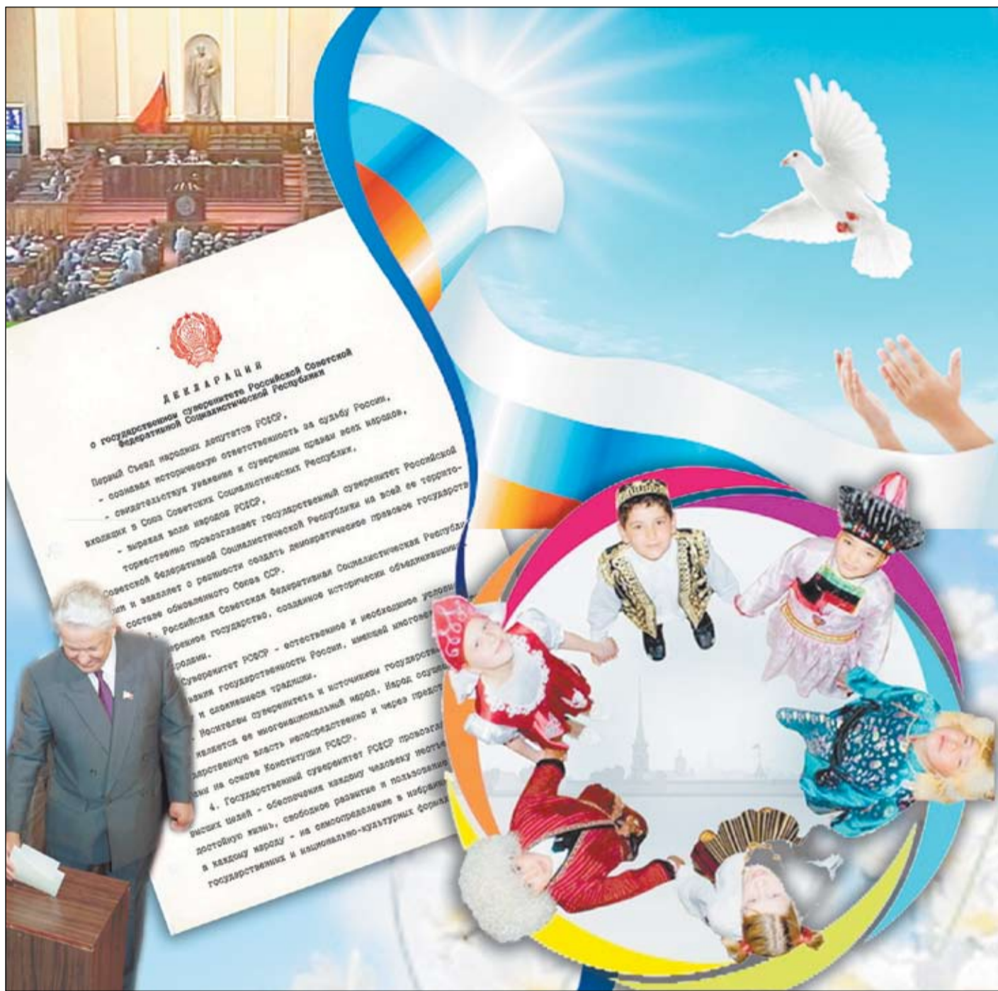
Коллаж Марины Бурлаковой

История возникновения этого праздника такова. В 1990 году Съезд народных депутатов РСФСР (высший законодательный орган республики на тот момент) принял Декларацию о государственном суверенитете России. В 1994 году этот день был объявлен государственным праздником – Днем независимости России (с 2002 года – Днем России). По сути - это самый главный из современных праздников в стране, поскольку олицетворяет собой день рождения государства - Российской Федерации. Именно с этой даты ведет свой отсчет становление новой российской государственности, основанной на принципах демократии, федерализма и рыночной экономики, которые формально были закреплены принятием Конституции РФ в 1993 году. Хотя многие сегодня рассматривают принятие Декларации о суверенитете как событие, ускорившее распад СССР. Но это не умаляет значения праздника. В День России мы чествуем нашу Родину, самую большую страну в мире, Окончание на 16-й стр.