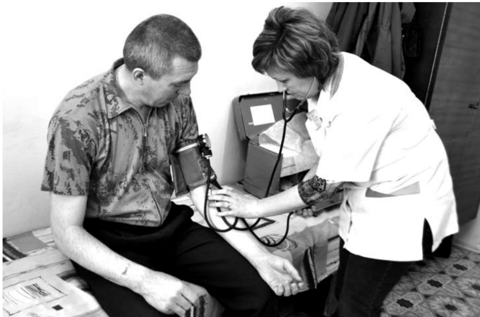
Кабинет неотложной помощи в южной части города существенно разгрузил работу «скорой».