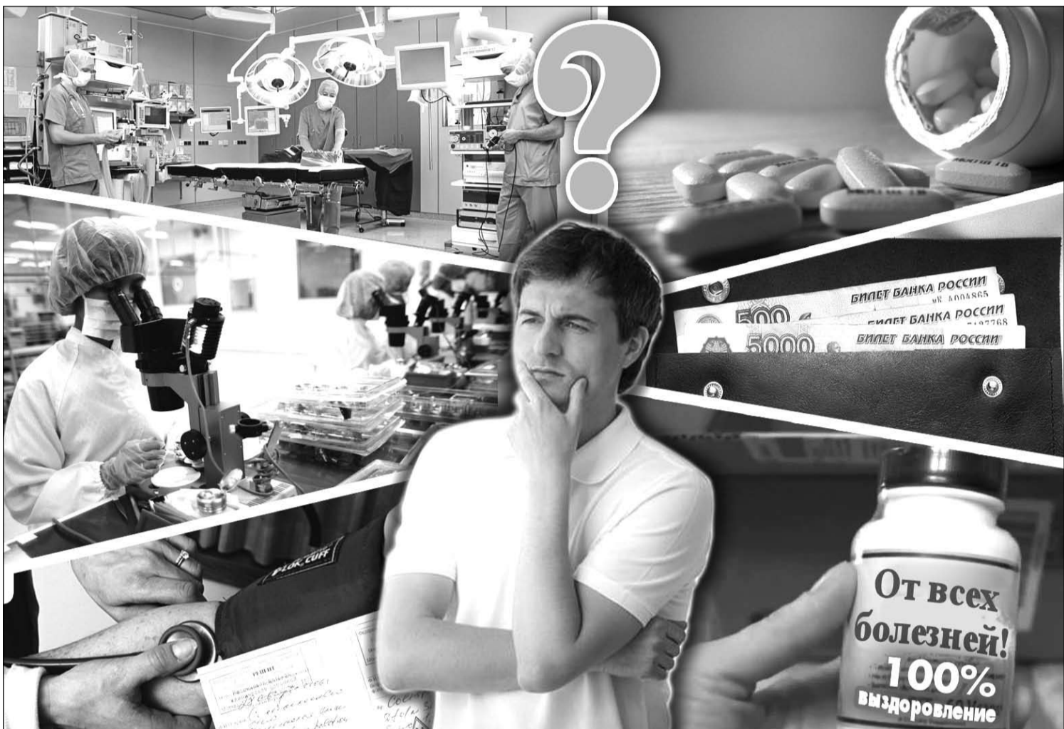
Сегодня выпускается множество БАДов, обеспечивающих наш организм необходимыми элементами. Главное - ответственно подойти к их выбору.