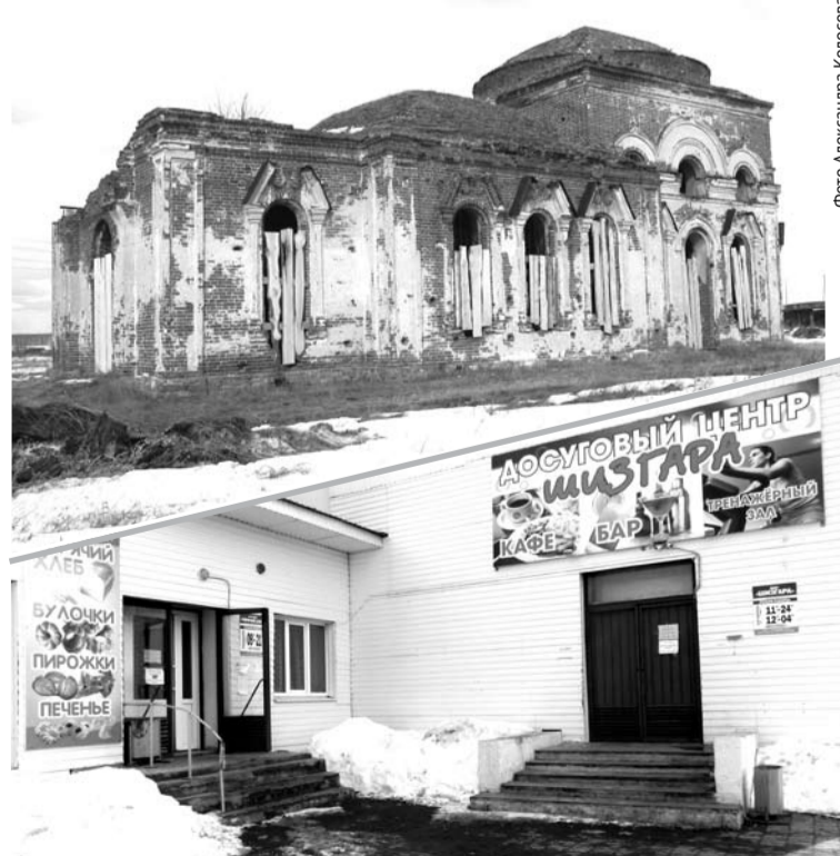
На Барабинской территории два села. В Куликах достопримечательность - Христорождественский храм, а в Барабе - досуговый центр «Шизгара».