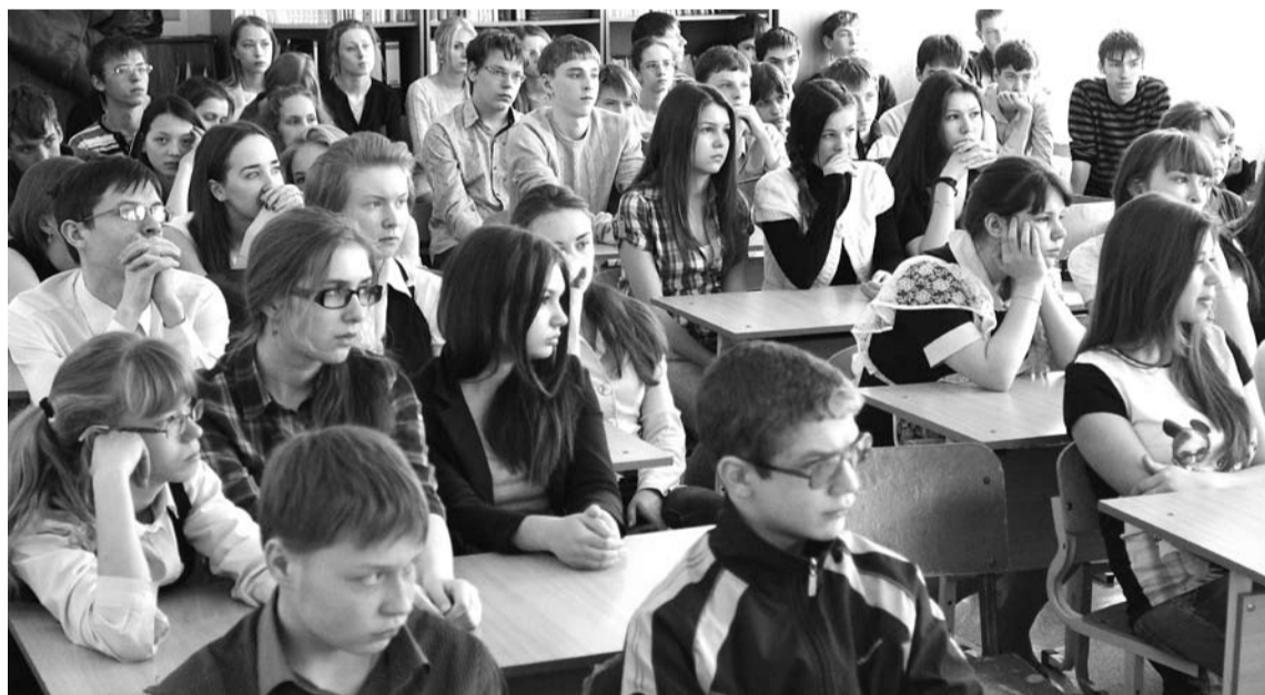
Преподавание нравственных основ семейной жизни не входит в современную образовательную программу школы. Но, судя по заинтересованным взглядам детей, необходимо.