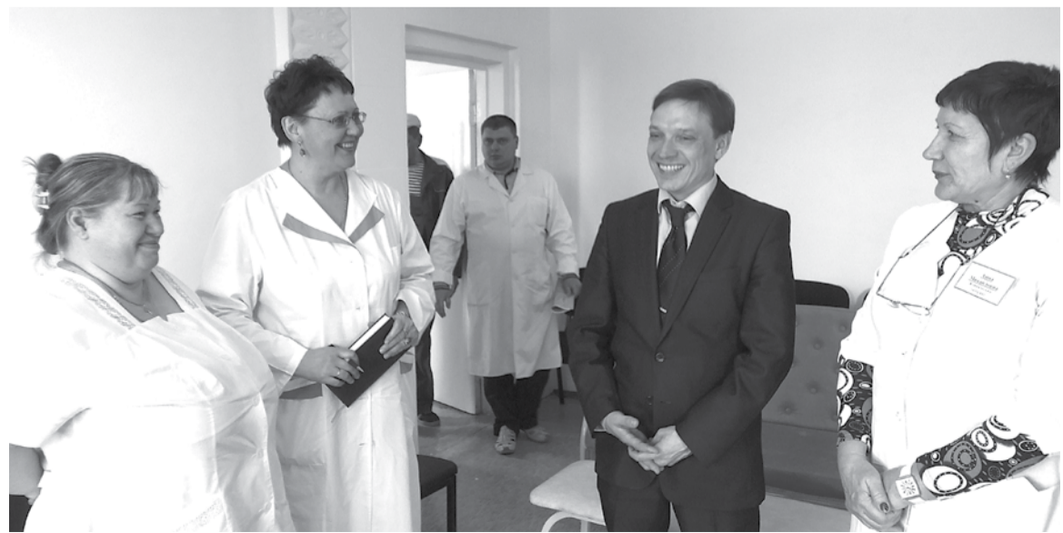
Подобные диалоги власти с трудовыми коллективами позволяют обсудить состояние дел в округе и на предприятиях.