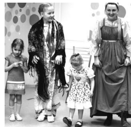
Дети с удовольствием пели русские народные песни, танцевали.