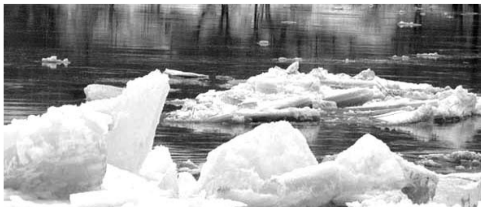
В ГО Богданович на период весеннего половодья разработан план мероприятий по предупреждению чрезвычайных ситуаций.

Что касается мер по обеспечению пожарной безопасности в лесах, расположенных на территории городского округа, то и в этом направлении Богданович проводит активную работу.