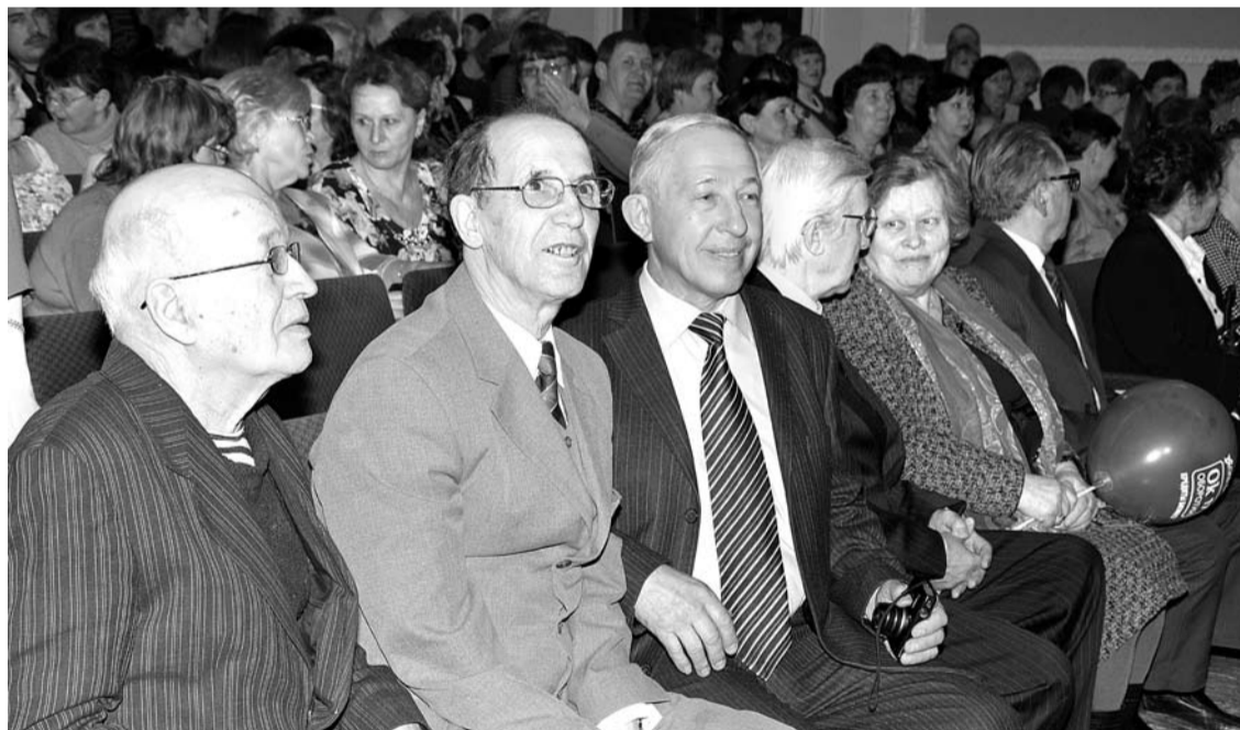
Много теплых слов прозвучало в адрес ветеранов политехникума, которые внесли большой вклад в развитие образовательного учреждения.

Председатель Законодательного Собрания Свердловской области Людмила Бабушкина отметила, что политехникум дал путёвку в жизнь более 15 тысячам выпускников, которые живут и работают не только в Богдановиче, но и в других городах нашей области и страны. Это