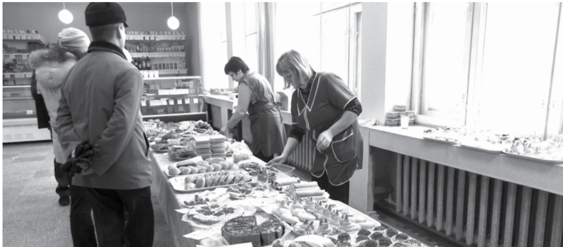
Посетители выставки-продажи были приятно удивлены большим разнообразием и красочным оформлением кулинарных изделий.