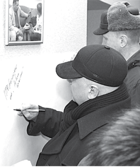
Во время посещения редакции газеты «Про Лесной» журналисты муниципальных газет области оставили пожелания и автографы своим коллегам.