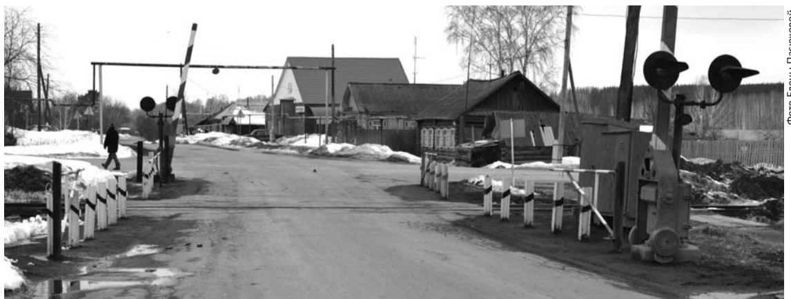
По территории Байнов проходит железная дорога, соединяющая огнеупорный завод с карьером, в котором добывают огнеупорную глину.