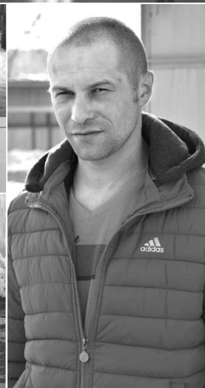
Люди на Тыгишской территории живут по-разному, но большинство из них к жизни относится с оптимизмом.