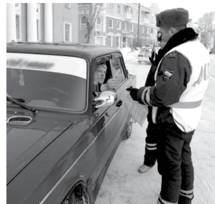
В ходе мероприятия с водителями проводятся профилактические беседы.

В образовательных учреждениях городского округа Богданович для детей проходят занятия, беседы, викторины, конкурсы и другое. Сотрудники ГИБДД обследуют улично-дорожную сеть вблизи каждого детского образовательного учреждения, а также в зонах организованного досуга детей и подростков (парки, Дома культуры, торговые центры).