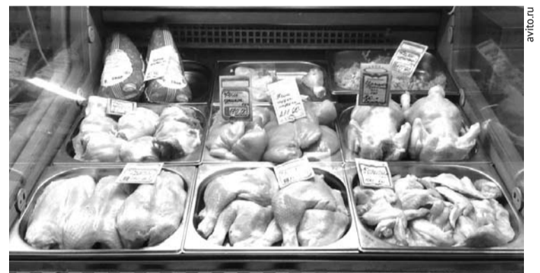
Магазины предоставляют покупателям большой выбор продуктов, качество которых не всегда соответствует норме.

Последняя плановая проверка магазинов ТС «Монетка» проводилась в 2011 году, в результате было вынесено 121 постановление о назначении административного наказания на общую сумму 581900 рублей. За последние три года в адрес Роспотребнадзора поступило всего одно обращение от граждан с жалобой на несоответствие сроков годности продукта, приобретённого в магазине ТС «Монетка». В результате внеплановой проверки было