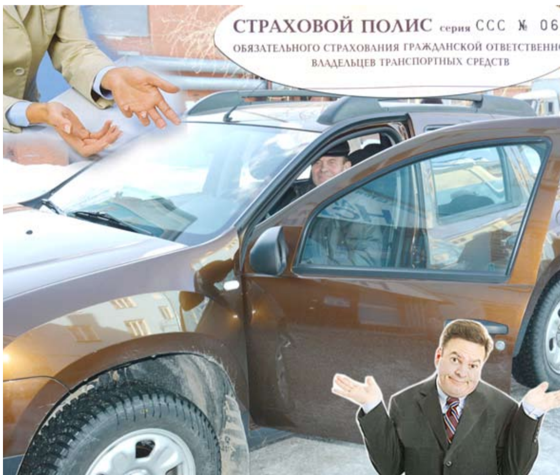
Страховые компании отказывают в страховании по полису ОСАГО, зачастую не давая четких объяснений причин отказа.