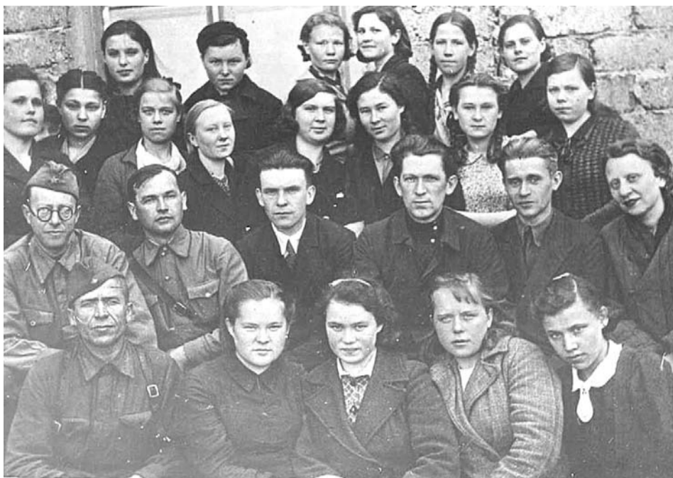
Первый выпуск учащихся Богдановичского горно-керамического техникума. 1945 год.

Коллектив и студенты политехникума приглашают всех выпускников и коллег на торжественное празднование 70-летнего юбилея в ДикЦ 28 марта 2014 г., в 14:00.