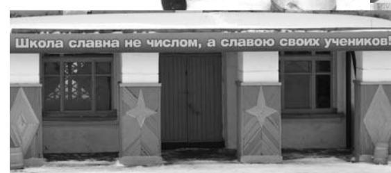
И взрослых, и детей Ильинской сельской территории объединяет любовь к своей малой родине.