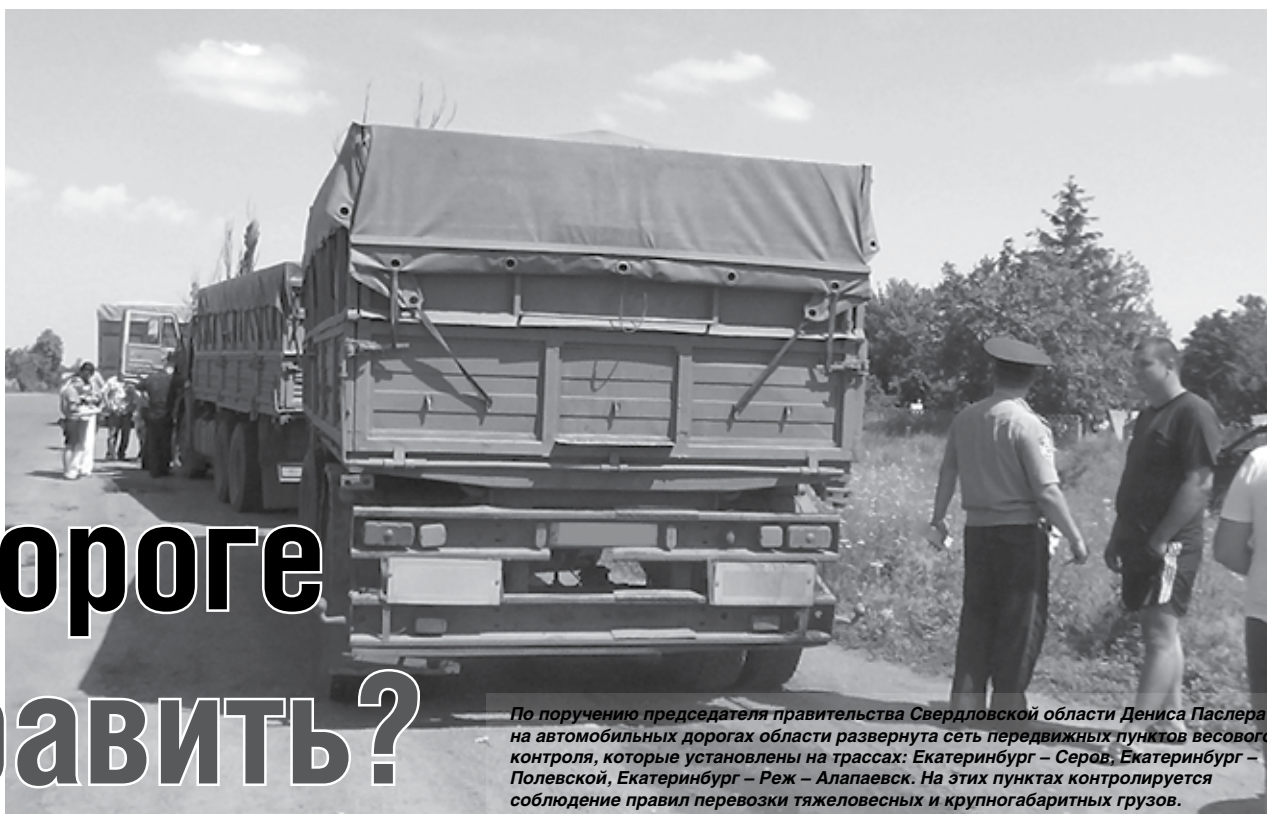
По поручению председателя правительства Свердловской области Дениса Паслера на автомобильных дорогах области развернута сеть передвижных пунктов весового контроля, которые установлены на трассах: Екатеринбург – Серов, Екатеринбург – Полевской, Екатеринбург – Реж – Алапаевск. На этих пунктах контролируется соблюдение правил перевозки тяжеловесных и крупногабаритных грузов.

Перевозить грузы промышленных предприятий предлагается не на автомобильном, а на железнодорожном транспорте. Такое предложение в этом году озвучило региональное министерство транспорта и связи. Это обосновано влиянием тяжёлых машин на дорожное полотно. Весной и летом на автомобильных дорогах Свердловской области традиционно на месяц устанавливается временное ограничение движения тяжеловесного транспорта, чтобы сохранить от разрушения дорожное покрытие. Вынужденная мера в первую очередь касается компаний-грузоотправителей и перевозчиков.