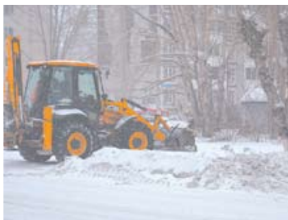
КАК В ГОРОДЕ УБИРАЮТ СНЕГ