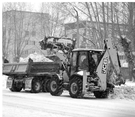
Очередной раз вывозить снег МУП «Благоустройство» начало 19 февраля с улицы Гагарина.

– В связи с накоплением снега на перекрёстках и в местах его временного складирования, а также в местах обра-