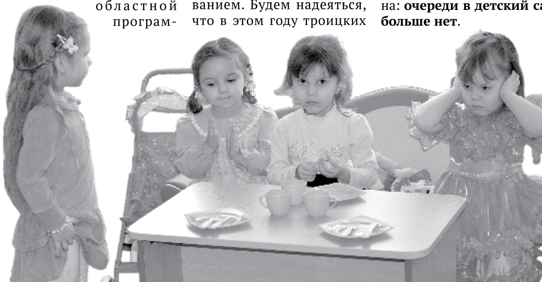
Воспитанницы Троицкого детсада сразу начали играть новой посудкой.