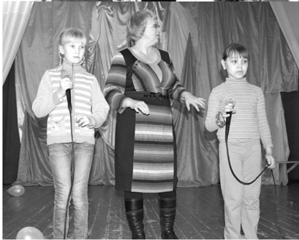
Вот такие лица и ситуации в Троицкой территории – люди живут и не унывают.