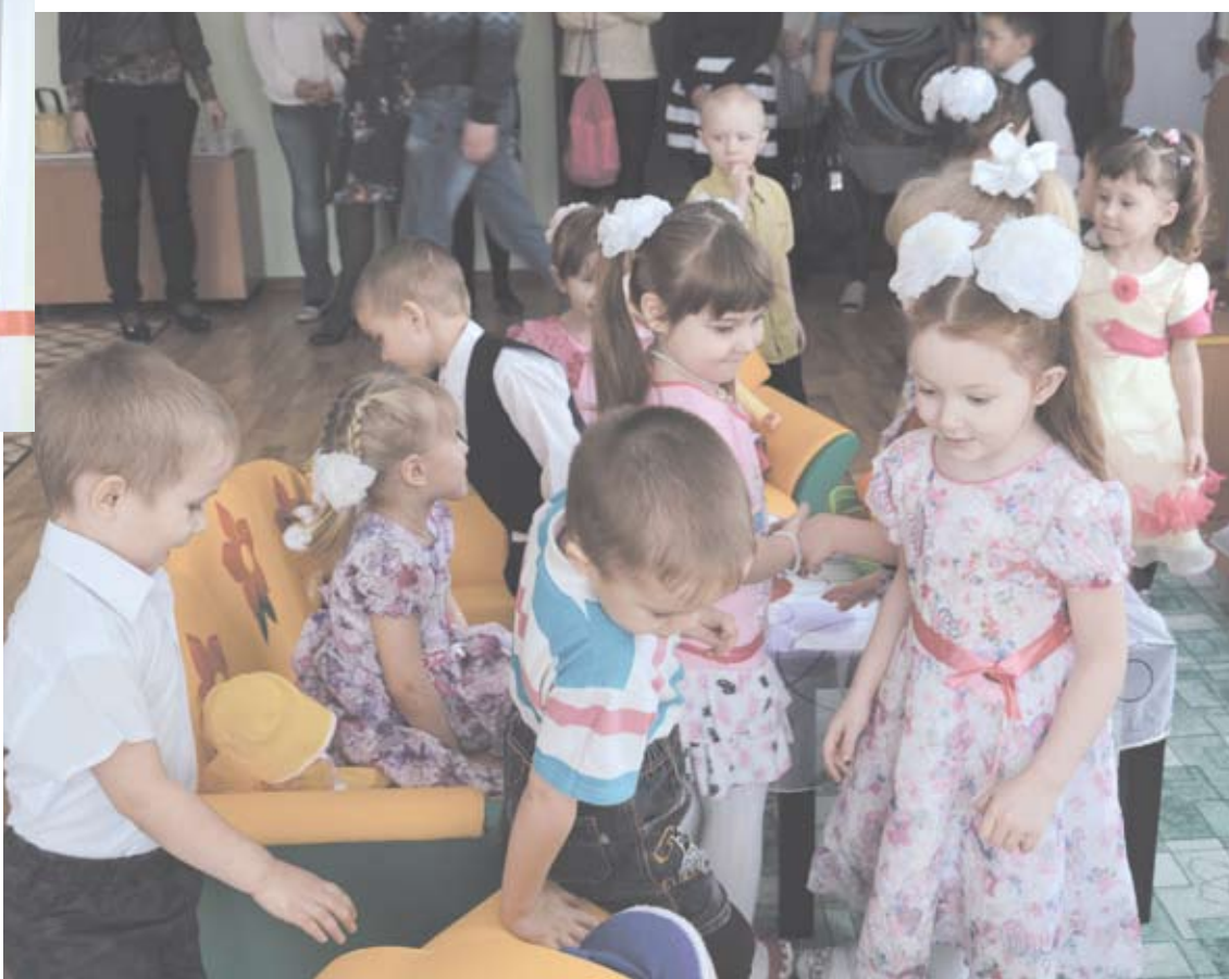
Дети долго и с интересом осматривали красивую новую мебель и пробовали на ней посидеть.