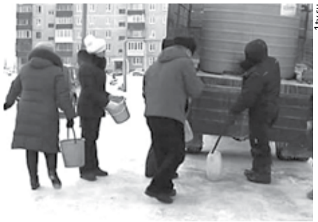
ПОМОГАЕМ СУХОЛОЖЦАМ СООБЩА