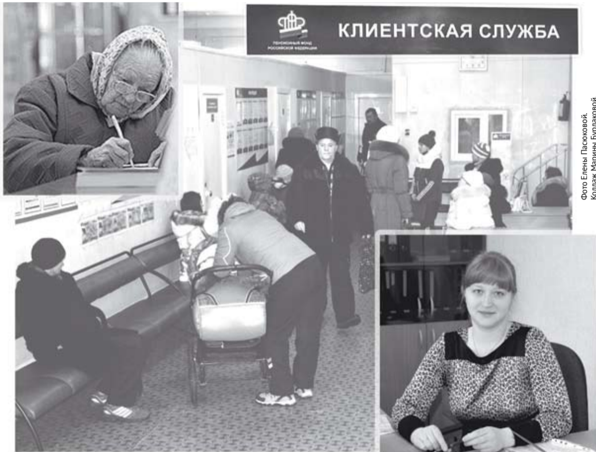
Ежедневно в клиентской службе Пенсионного фонда много посетителей.