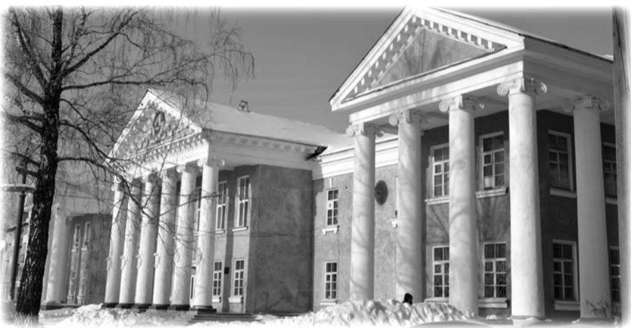
Сегодня здание БПТ украшает площадь Мира, а педагоги политехникума готовят специалистов рабочих профессий для предприятий нашего городского округа.