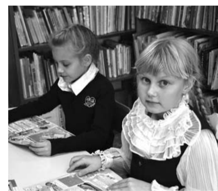
Библиотека сегодня стала настоящим информационным центром школы.

– С ноября 2013 года у нас начала работу «Школа будущего первоклассника». Для этого мы разработали ло-