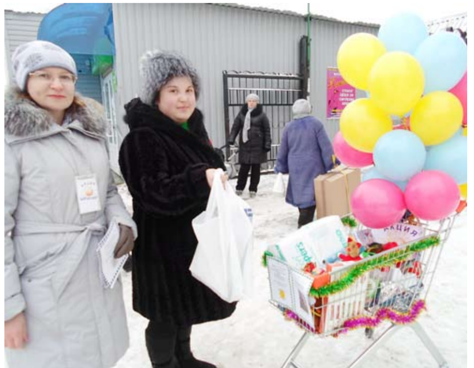
В ходе благотворительной акции «Подари радость ребенку» было собрано большое количество детских товаров, которые были вручены больным детям.

Продолжить дело милосердия могут организации и учреждения ГО Богданович и все, кто желает помочь благому делу в сборе средств на автомобиль для инвалидов. Средства можно перечислить по следующим