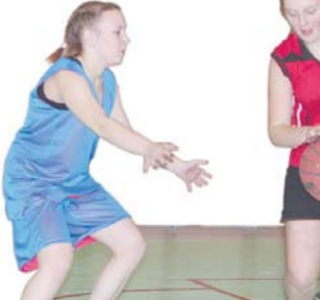
Стритбол в настоящее время популярен более чем в 160 странах мира.

Фестиваль физкультуры традиционно открыл спортивно-оздоровительный блок — VIII турнир