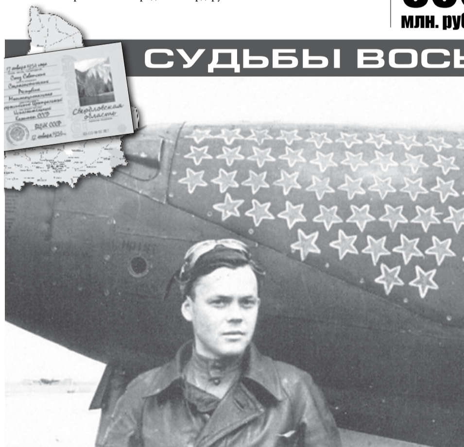
Рекорд уральца Г.А.Речкалова на американском истребителе Bell P-39 Airacobra в годы Великой Отечественной войны так никто и не побил. Воздушный ас совершил 450 боевых вылетов, провёл 122 воздушных боя, сбил 61 самолёт противника.

Через год к 95-летию юбилею Григория Речкалова в посёлке Зайково земляки собираются создать патристический клуб с мемориальным залом, посвящённым Герою – уральцу.