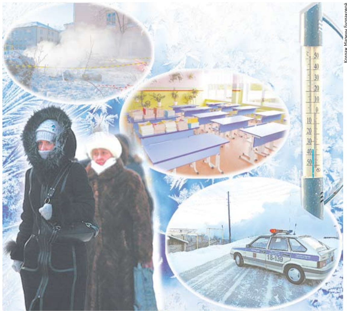
Коллаж Марины Бурлаковой.

В сильные холода, которые нам довелось пережить на минувшей неделе, случилось много непредвиденного, но сообщать мы справились с проблемами.