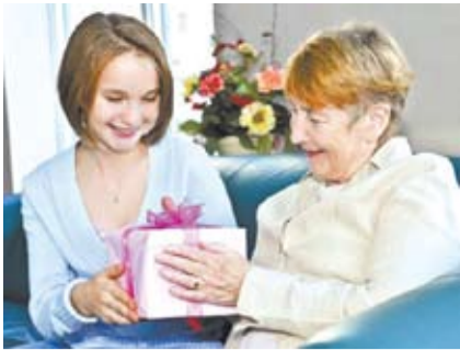
В БОГДАНОВИЧЕ СТАРТУЕТ БЛАГОТВОРИТЕЛЬНАЯ АКЦИЯ Стр. 2.