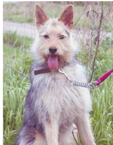
Очаровательный Брукс надеется, что скоро у него появится хозяин.