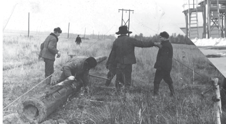
Ремонтные работы на воздушной линии электропередачи в 1970-е годы.