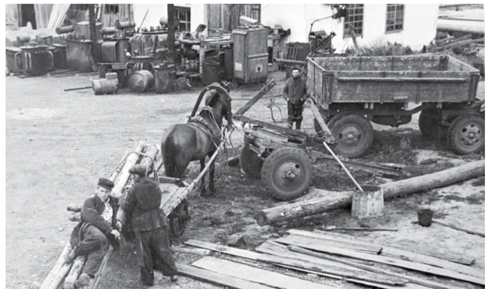
Это сегодня в ВЭС совершают перевозки на автомобилях, а в 60-е годы основной тягловой силой была лошадь.

В 2003 году вышел федеральный закон «Об электроэнергетике», установивший правовые основы экономических отношений в этой сфере. В нем впервые появилось понятие «технологическое присоединение» к электрическим сетям. Один из крупных проектов, выполненных в рамках техприсоединения на территории ВЭС: реконструкция подстанции «Черданцы» с установкой вто-