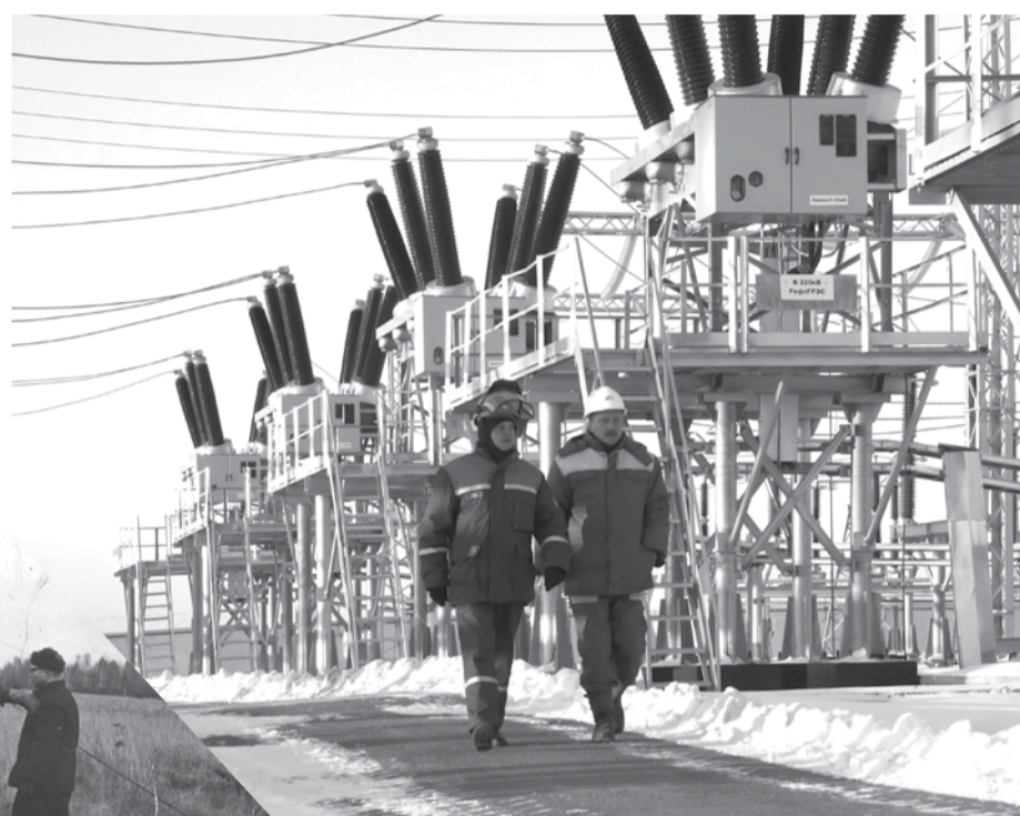
Подстанция «Анна», находящаяся на границе Богдановичского и Суходолжского районов, соответствует всем современным требованиям.