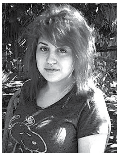
Дети – цветы жизни, а наркотики превращают их в сорняки.

Самые распространенные среди молодежи наркотики – курительные смеси JWH