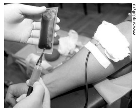
Каждый, кто заботится о своем здоровье, должен раз в год пройти тестирование на ВИЧ-инфекцию.

Далее члены комиссии заслушали сообщения представителей учреждений образования, культуры и спорта, а также предприятий города о проведенных мероприятиях по профи-