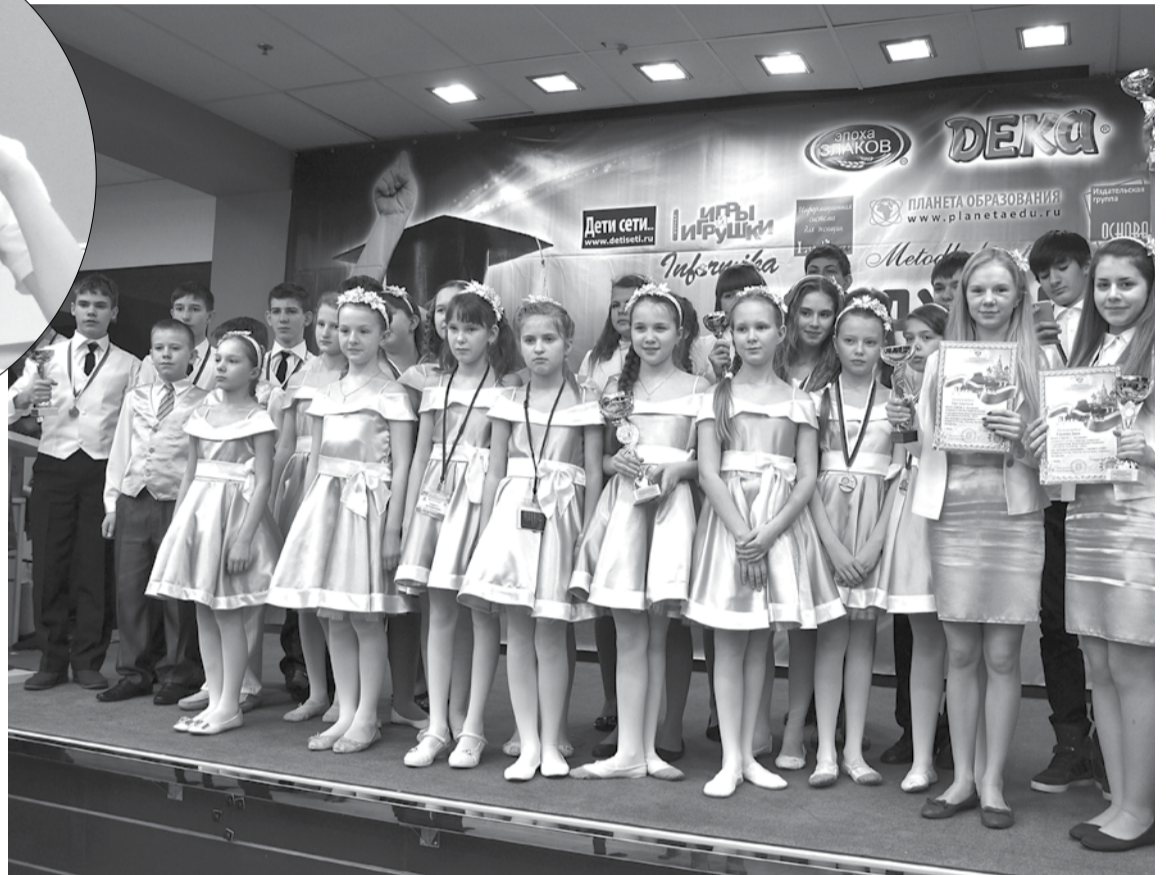
На олимпиаде «Эрудиты планеты» команды учащихся школ №№ 2, 3, 5 достойно представили ГО Богданович. Программа олимпиады включала в себя не только интеллектуальные баталии, но и незабываемые экскурсии по Москве.