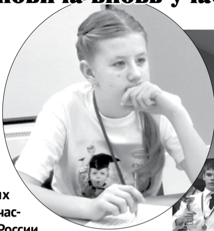
Окончание на 4-й стр.

В НОВОГОДНИЕ каникулы, когда большинство школьников беззаботно отдыхали, ребята из школ №№ 2, 3, 5 приехали в Москву, чтобы сразиться в интеллектуальных состязаниях «Эрудиты планеты», в которых участвовали дети из разных городов России, Казахстана, Украины, Белоруссии, Эстонии.