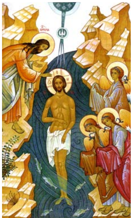
Икона «Крещение Господне».

Иоанн был человек праведный. Он рано удалился в Иудейскую пустыню и вел там жизнь аскета и подвижника, питаясь только тем, что давала ему пустыня. Впоследствии Иоанн сделался знаменит среди иудеев своей удивительной проповедью, в