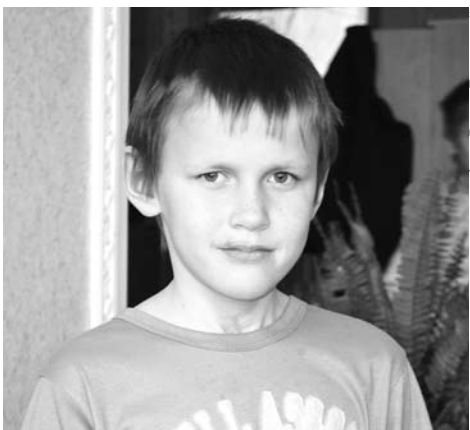
Дмитрий внимательно относится к собственному здоровью, любит раскраски.