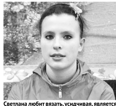
Светлана любит вязать, усидчивая, является участницей ярмарок, на которые заявляется учреждение.