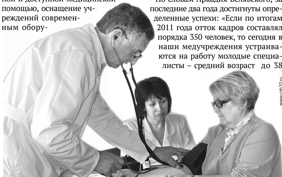
Проблема дефицита врачей в районных больницах планомерно решается министерством здравоохранения и правительством Свердловской области.

Департамент информационной политики губернатора Свердловской области.