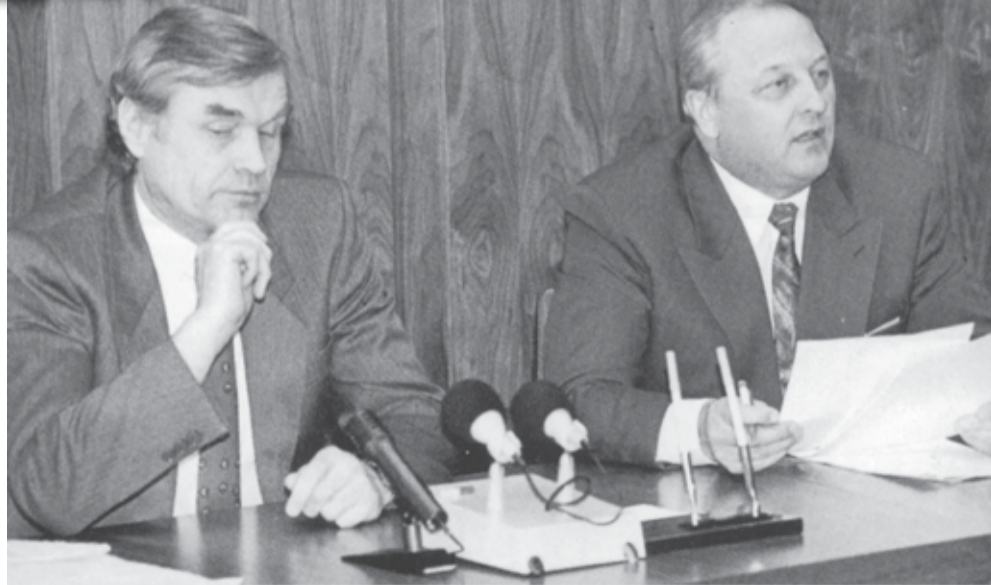
На снимке: Вячеслав Сурганов и Эдуард Россель на одном из первых заседаний Областной Думы (90-е годы).