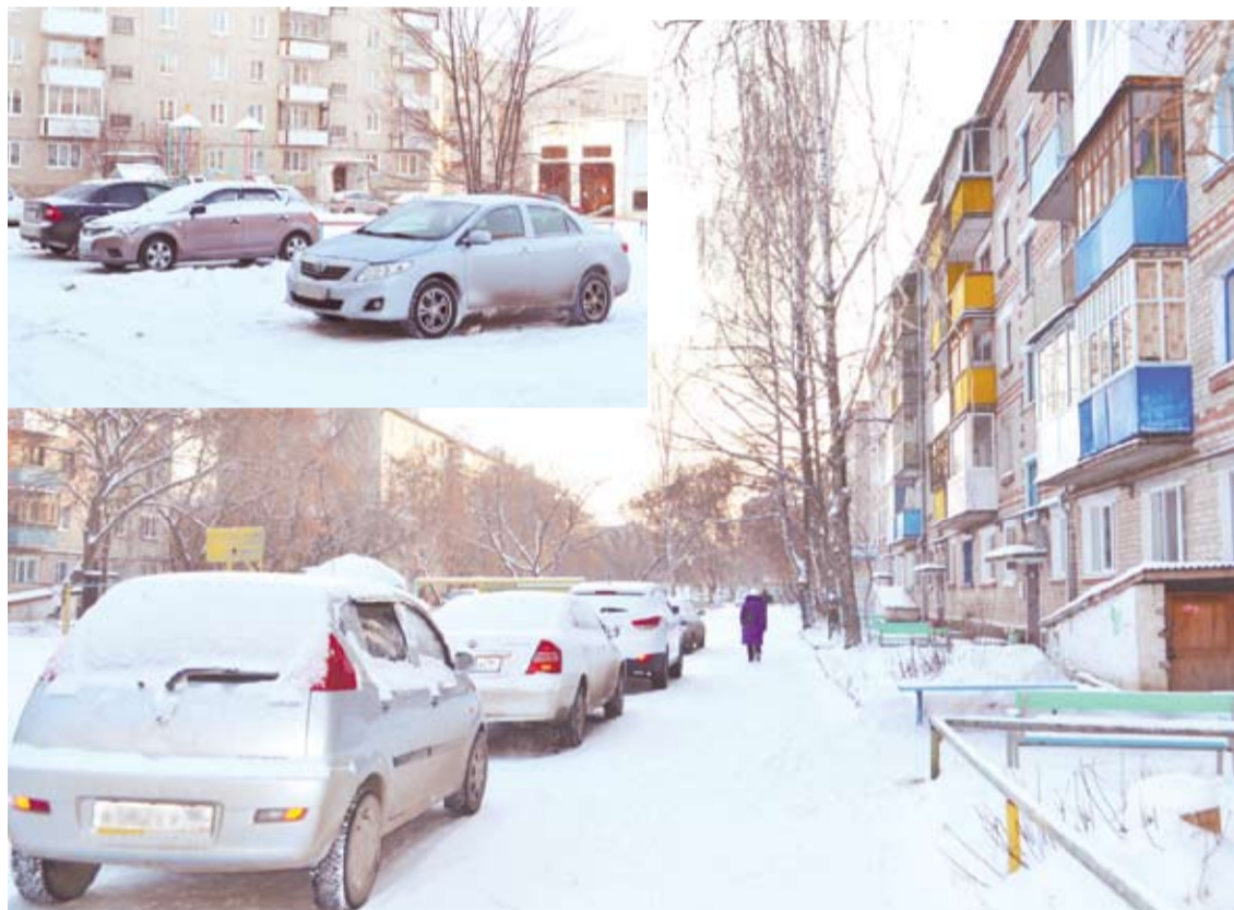
Особой «захламленностью» автомобилями отличаются дворы домов № 34 на ул. Гагарина (вверху) и № 14 на ул. Партизанской.

Может быть, всё-таки пожалеете дворников, дорогие автолюбители, и освободите тротуары и дворы проезды от своих автомобилей, поставив их туда, куда положено – на специально оборудованные автостоянки? И машины будут целей, и дворы чище.