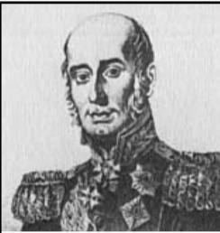
Михаил Богданович Барклай-де-Толли (1761–1818) 18 августа 1813 года в сражении под Кульмом (Богемия, ныне Чехия).