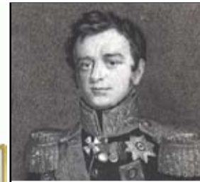
Иван Федорович Паскевич (1782-1856) В 1829 году за взятие турецкого города Эрзерума в Русско-турецкой войне 1828–1829 годов.