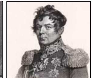
Иван Иванович Дибич (1785-1831) За успехи в Русско-турецкой войне 1828–1829 годов.