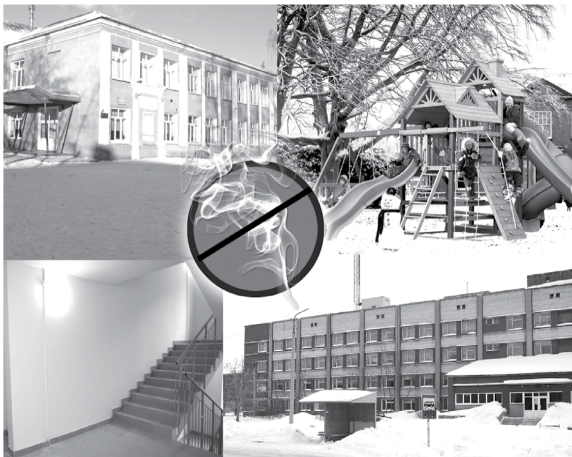
Коллаж Марины Бурлаковой