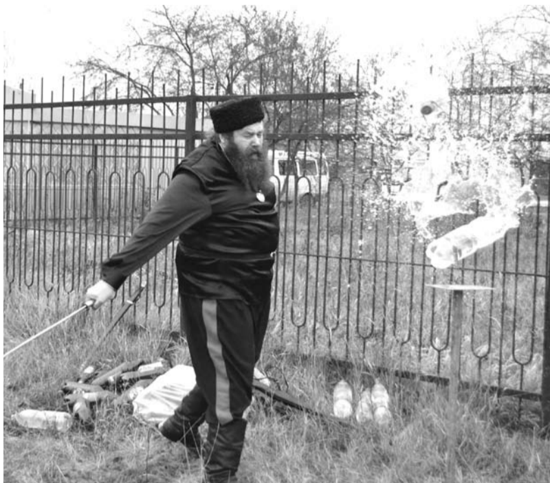
Казачи зря шашками не машут. На празднике, посвященном Дню народного единства, представители казачества показали свои умения управляться с этим оружием в мирных целях.