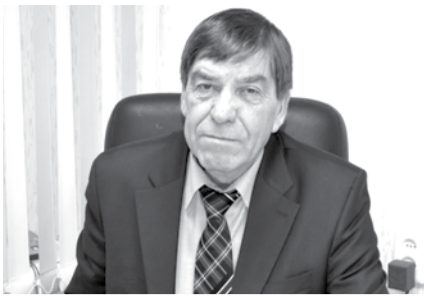
ПРЕДСЕДАТЕЛЬ ДУМЫ ГО ОТВЕТИЛ НА ВОПРОСЫ БОГДАНОВИЧЦЕВ