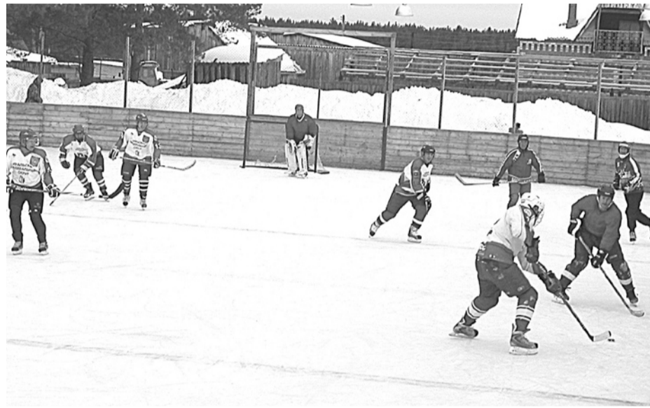
Атаку «Звезд» отражают богдановичские «Ветераны».