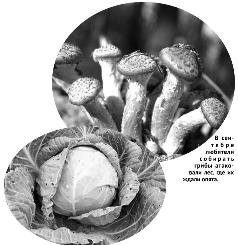
В сентябре любители собирать грибы атаковали лес, где их ждали опять.