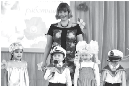
ДОШКОЛЬНЫЕ РАБОТНИКИ ОТМЕТИЛИ СВОЙ ПРАЗДНИК Стр. 2.