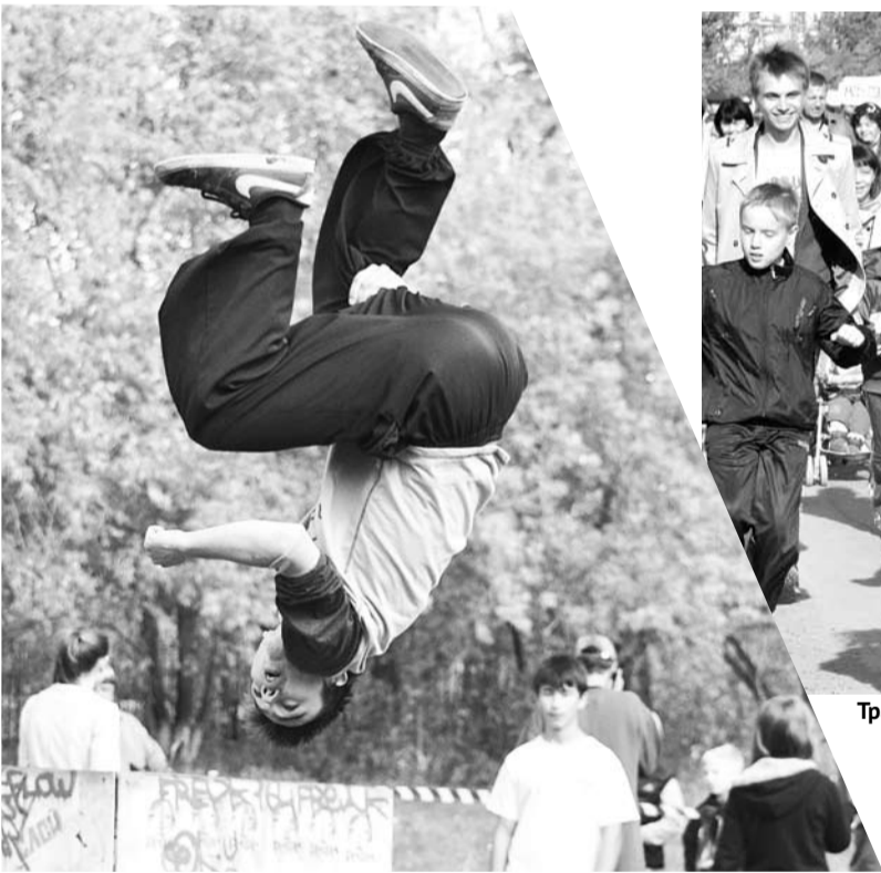
Экстремалы проводили лето по-своему: с огоньком и задором.