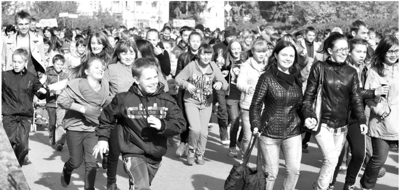
Традиционный сентябрьский забег собрал богдановичцев. Все от мала до велика пробежали на «Кроссе нации-2013».