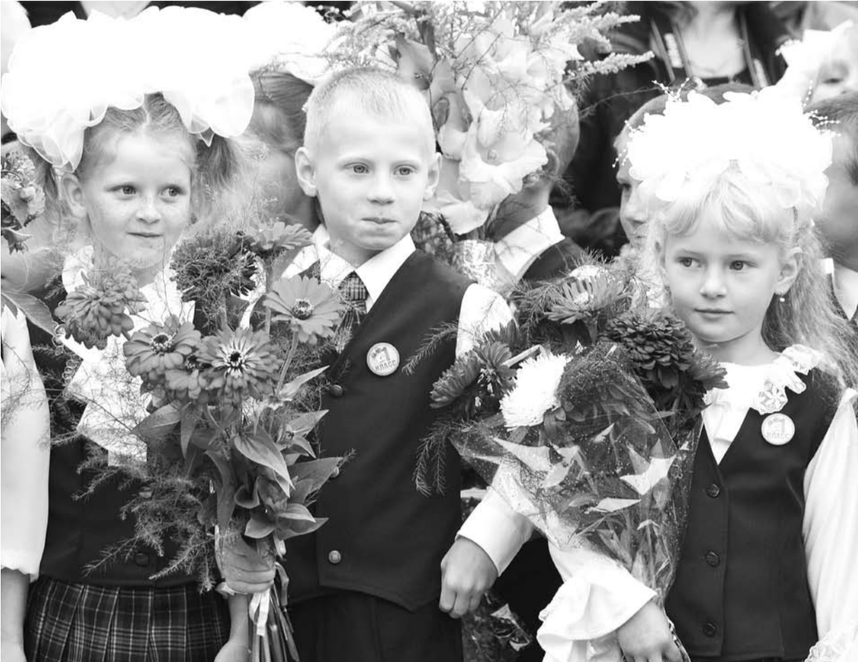
Осень для школьников начинается с первого звонка. Первоклассники с волнением ждут свои первые школьные занятия.