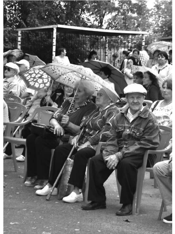
Весь месяц в Богдановиче проходили мероприятия, посвященные празднованию Дня пенсионера Свердловской области.