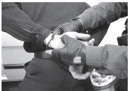
В БОГДАНОВИЧЕ ЗАДЕРЖАН РЕАЛИЗАТОР ГЕРОИНА