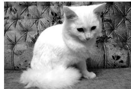
Этот котик ждёт своих хозяев.