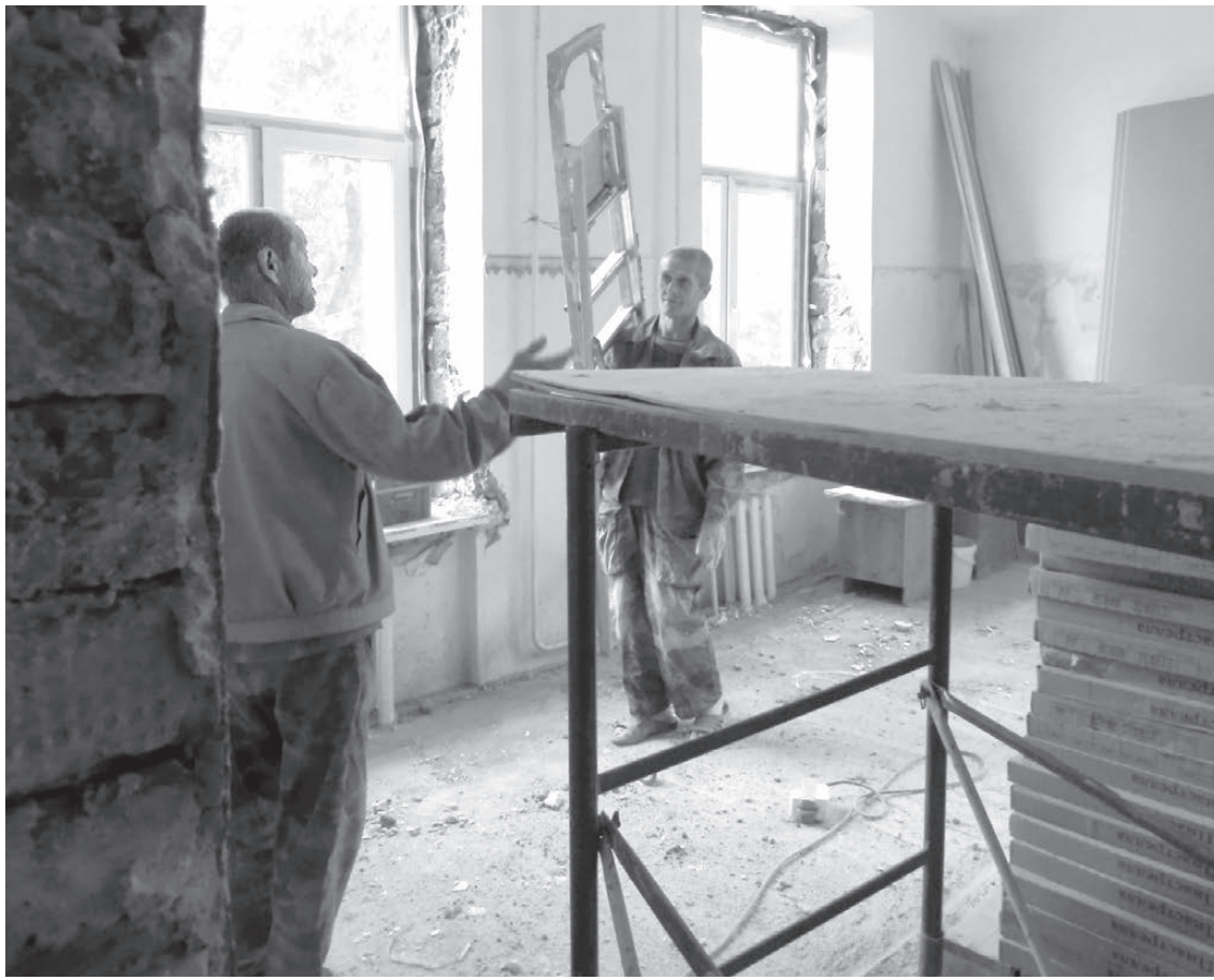
На втором этаже хирургического корпуса отделочные работы проводят работники ООО «Стройарт» и ООО «СРК» из Екатеринбурга.