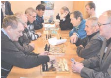
ДЛЯ ПЕНСИОНЕРОВ ПРОВЕДУТ СОРЕВНОВАНИЯ