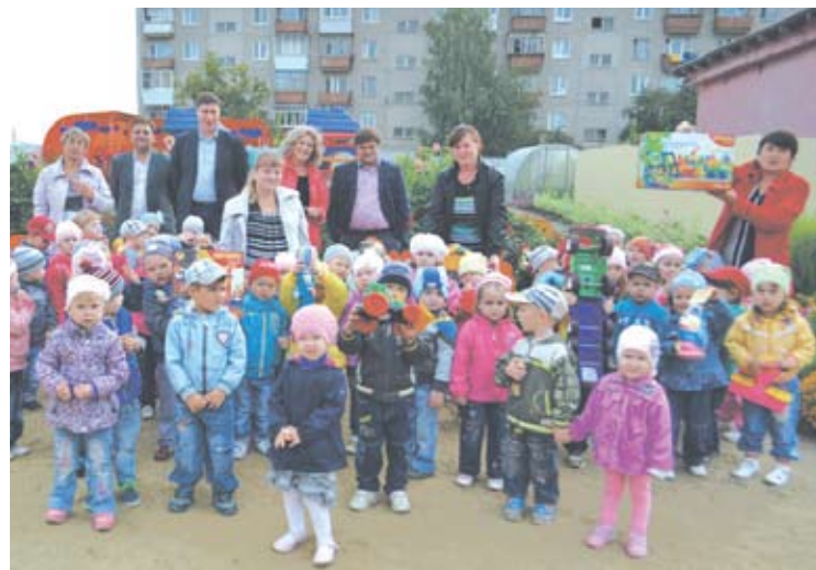
Поддержка «Детского сада Будущего» № 38 социальными партнерами важна для всестороннего развития образовательной среды учреждения и особенно приятна в день рождения.