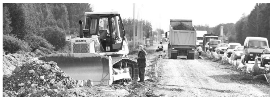
В скором времени на Сибирском тракте не будет пробок, и водители беспрепятственно смогут ездить по отремонтированной дороге.

- По условиям контракта, ремонт должен быть завершён в октябре текущего года.