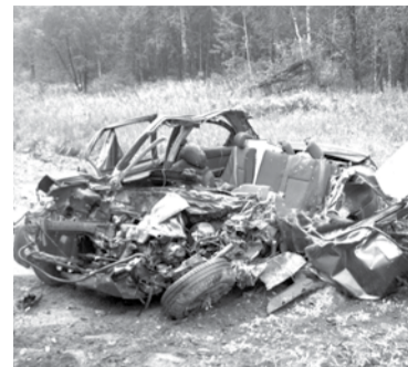
Груда железа – все, что осталось от автомобиля, в котором ехала молодая семья. В результате ДТП муж с женой погибли, их ребенок остался сиротой.

В воскресенье, 11 августа , на 80 км этой же автодороги произошло еще одно страшное ДТП. 24-летний