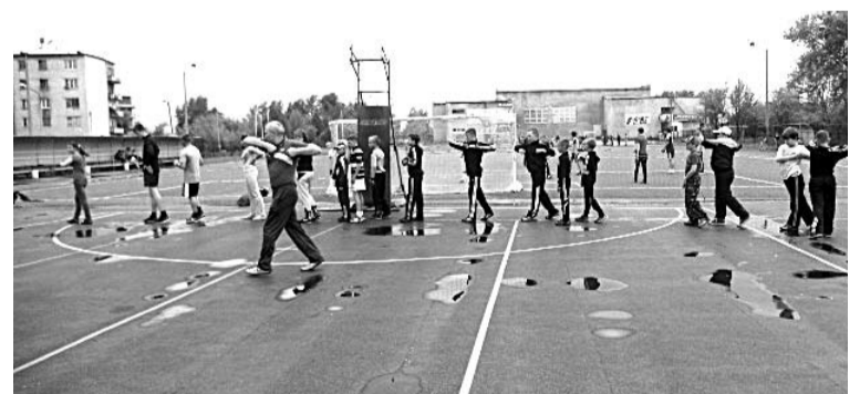
В спортивном лагере, организованном на базе СК «Колорит», каждое утро дети начинают с зарядки.

Всего за лето в спортивных лагерях отдохнуло около 632 юных спортсменов Богдановича. С новыми силами они приступят к учебе и пойдут навстречу очередным победам.