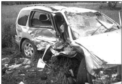
ТРАГЕДИИ НА ДОРОГЕ