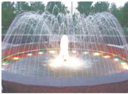
БЫТЬ ЛИ ФОНТАНУ В БОГДАНОВИЧЕ?