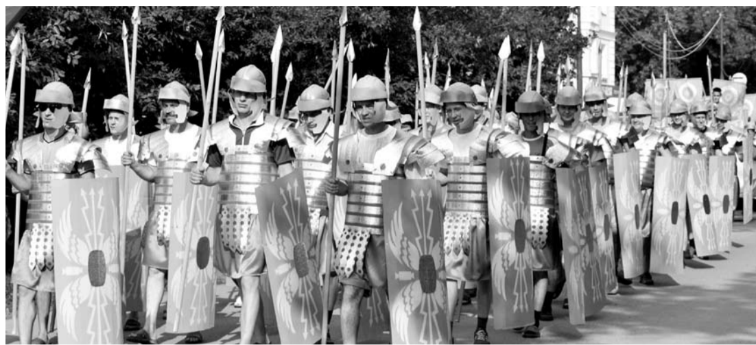
Стройным маршем прошли по улицам города к стадиону римские легионеры из огнеупорного завода.

ские самураи («Тепловодоканал» и «Городские очистные сооружения») шествовали рядом с французскими мушкетёрами (ЗАО «ПМК-2», ООО «ПМК»), испанский тореадор с быком (ОАО «Транспорт») соседствовал с арабскими шейхами (ОАО «Комбикормовый завод»).