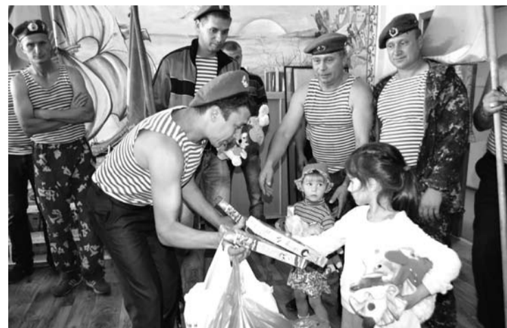
Мужественные десантники не забывают о детях. В день своего праздника «десантура приземлилась» в детском доме и вручила его воспитанникам подарки.

Продолжился праздник на базе отдыха «Кояш» (Прищаново), где десантники и спецназовцы провели соревнования по стрельбе из пневматической винтовки, армрестлингу, разборке и сборке автомата, футболу и перетягиванию каната.