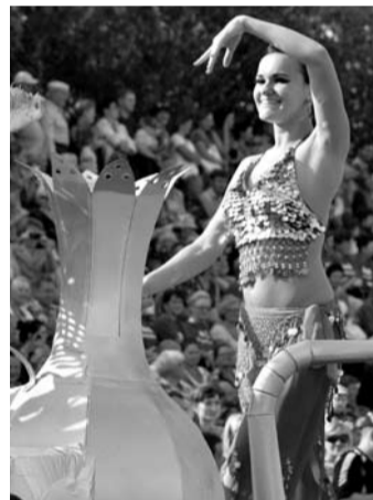
Прекрасная арабская танцовщица (комбикормовый завод) погрузила всех в волшебный мир Востока.

Кто только не участвовал в карнавальном шествии! Япон-