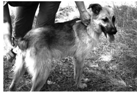
Если в семье есть дети, Варя – самый лучший вариант домашнего любимца.