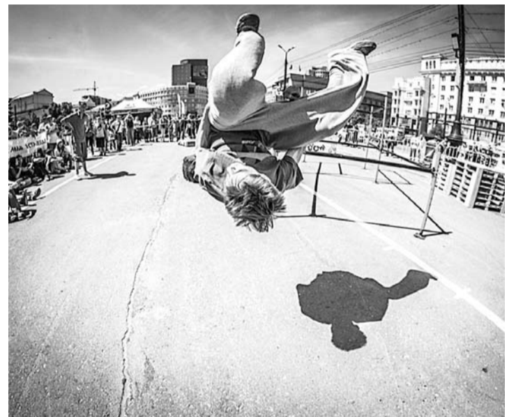
Каждый трюк трейсера требует огромных усилий и умения. Наши трейсеры смогли покорить Челябинск и доказали, что они лучшие в своем деле.

В фестивальной программе приняли участие более 60 трейсеров из Челябинска, Кургана, Магнитогорска, Екатеринбурга, а также парни из Богдановичского молодежного клуба «Экстрим Стайл», которые показали