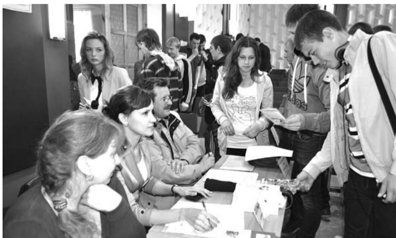
Задать работодателям интересные вопросы подошли лишь редкие выпускники, остальные спешно покинули актовый зал.

В ходе ярмарки представители предприятий познакомили выпускников с имеющимися вакансиями, рассказали подробнее о своих предприятиях и условиях труда. У выпускников была возможность и лично побеседовать с любым из работодателей.