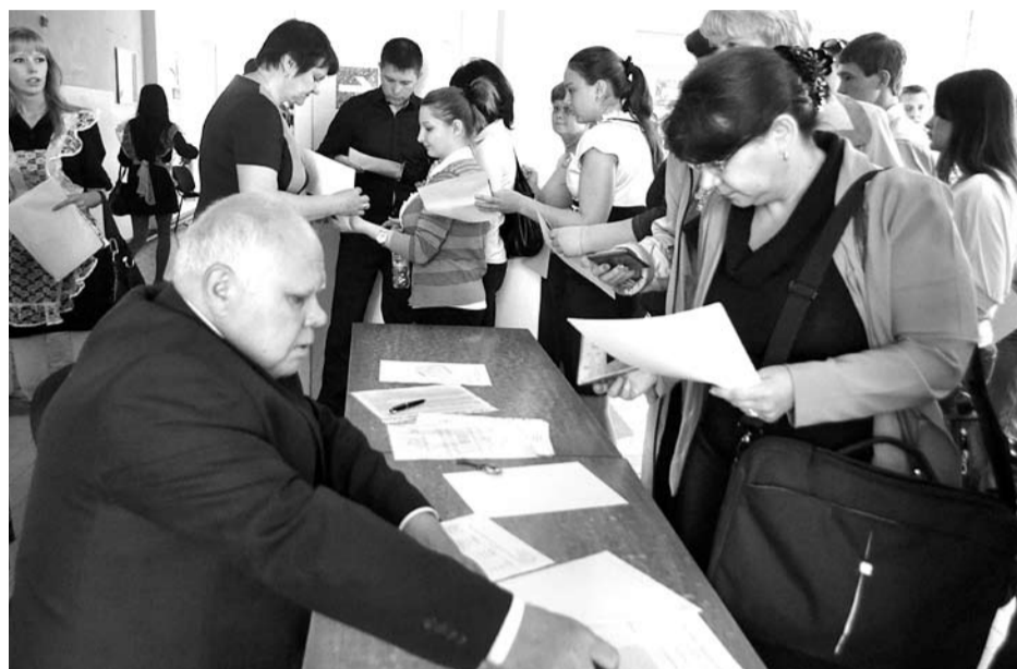
Перед сдачей ЕГЭ ученики и их сопровождающие проходят регистрацию. А дальше выпускников ждёт сложный и ответственный этап в жизни - сдача госэкзамена. На фото: идет регистрация в школе №5.

Впервые в этом году накануне экзаменов устанавливается минимальное количество баллов по всем