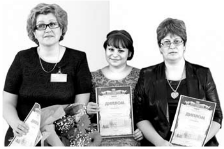
ВЫБРАНЫ ЛУЧШИЕ ВОСПИТАТЕЛИ ГОДА