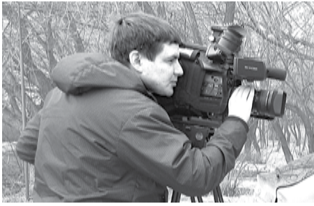
СМОТРИТЕ БОГДАНОВИЧ НА «ОТВ»