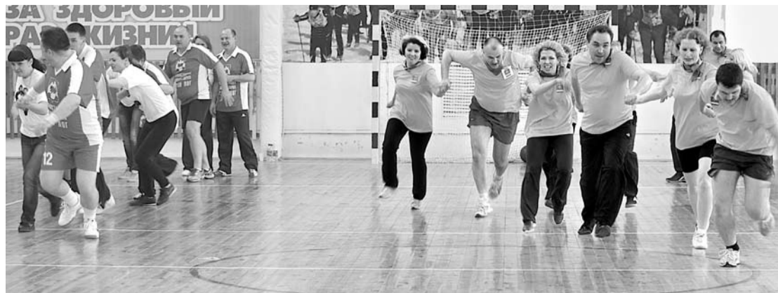
Непростые испытания сплотили команды чиновников Сухого Лога (слева) и Богдановича.