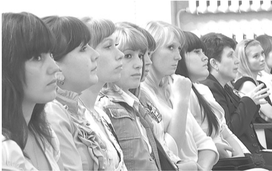
В этом году молодых учителей, пополняющих ряды учительства района, как никогда много.